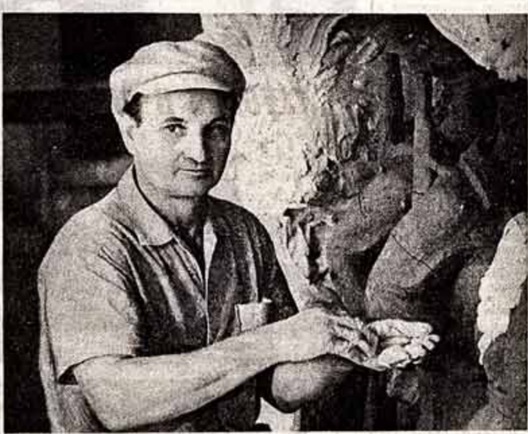
ПРОВЕРЯЕМ ВЫПОЛНЕНИЕ ОБЯЗАТЕЛЬСТВ