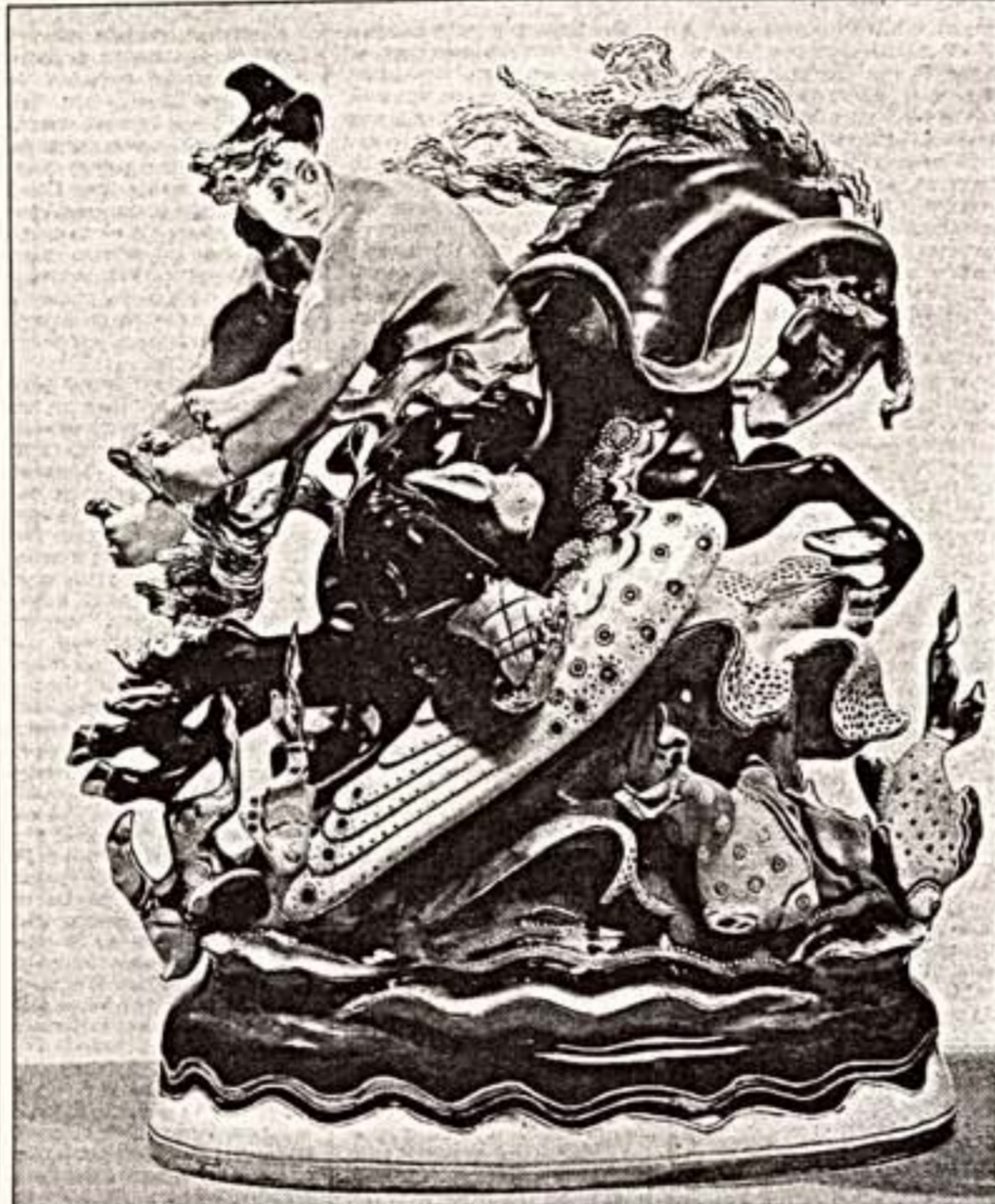
С. Орлов. "Иванушка на Коньке-Горбушке", 1928 г.

Советский фарфор в музее-усадьбе "Царицыно"