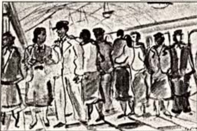
"Московское метро", 1950 г.