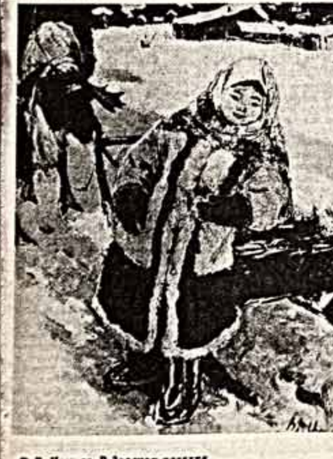
В. Игошев. В далекой тундре.

Г. ВЛАДИМИРОВА. Выставка открыта в Государственном музее Востока.