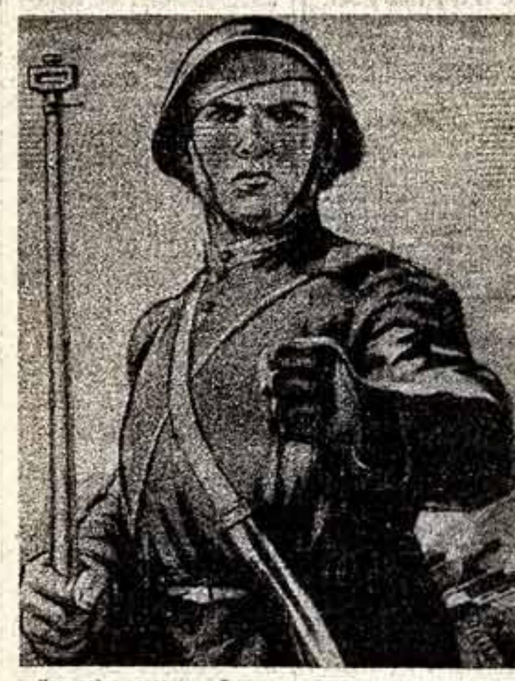
«Идет война народная...» Вот таким — солдатом, вставшим на пути врага, — было то время, о котором сегодня, четверть века спустя, говорит нам плакат Алексея Кожуркина.

Начавшаяся 22 июня 1941 года война, навязанная Советскому Союзу германским фашизмом, была самым крупным военным столкновением социализма с ультра-либеральным империализмом. Она стала Великой Отечественной войной советского народа за свободу и независимость социалистической Родины, за социализм. В гигантском военном столкновении с империализмом и его наиболее чудовищным порождением — фашизмом победила социалистический общественный и государственный строй. Источниками силы Советского Союза явились социалистическая экономика, социализм-патристическая и идейное единство общества, советский патриотизм и дружба народов СССР, сплоченность народа вокруг партии коммунистов, беспримерный героизм и мужество советских воинов. Это была победа социалистической идеологии над капиталистической идеологией империализма и фашизма.