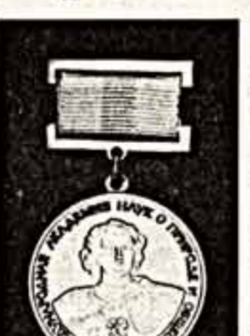
Медаль имени Петра Великого