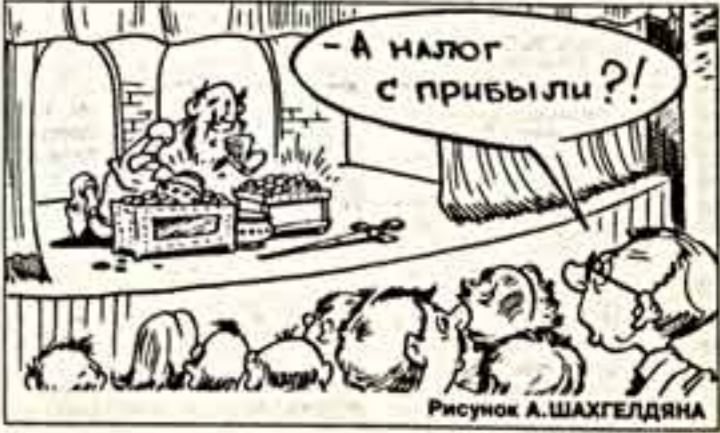
Рисунки А. ШАХГЕДЯНА