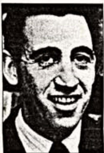
Дж. Д. Сэллинджер

Последний раз Сэллинджер печатался летом 1965 года в "Нью-Йоркере". Этот известный журнал его открыл, он его и "закрыл". Критики привычно поругали крошечную повесть "16-го Января 1926 года" — переосмысление семилетнего выживания Сэмюэля в припадочном состоянии.