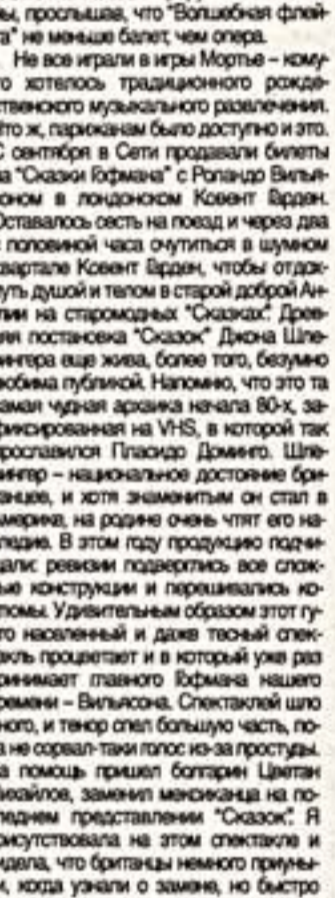
Игнат КУРАКИН