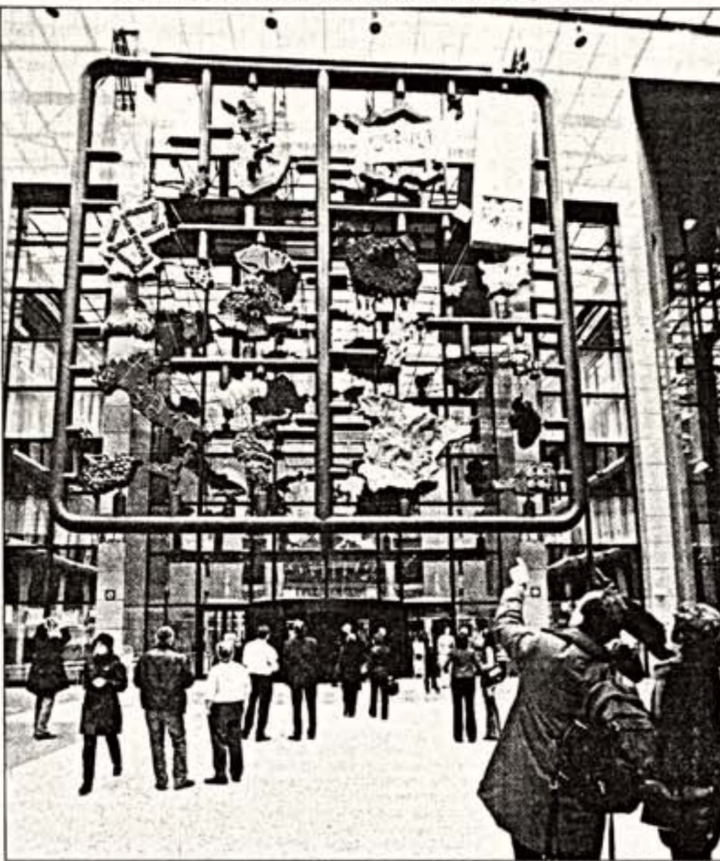
Вверху: "Entropa" Д. Черны в здании Совета ЕС в Брюсселе. Внизу: фрагмент инсталляции, изображающий Данию

Визит-премьер Чехии, которая сейчас возглавляет ЕС, Александр Вондра недавно посетил Болгарию и другие страны южного крыла, которые моты охотились скандалом инсталляции у здания Совета Европы в Брюсселе.