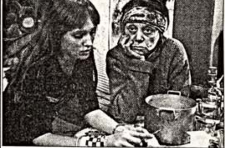
На съемочной площадке

Московский театр Новая Опера им. Е.В.Колубова ОБЪЯВЛЯЕТ КОНКУРС на должность ассистента режиссера. К конкурсу допускаются лица, имеющие высшее образование режиссера музыкального театра. Запись по телефону: 8 (495) 694-11-13