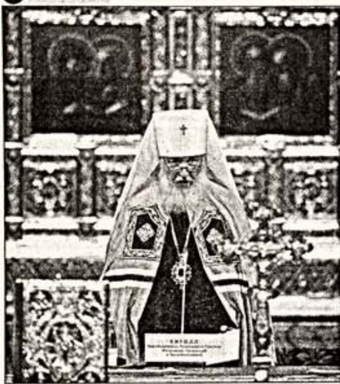
Патриарх Кирилл I