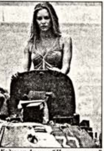
Кадры из фильма "На краю стою"