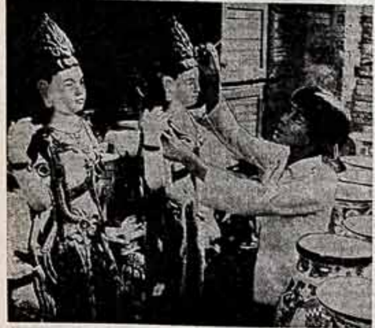
Продукция Донбасского керамического завода близ Хоршакского завода не только в стране, но и за рубежом. Более 170 наименований изделий экспортируются каждый год в 12 стран мира, в том числе в Советский Союз. Ваза, искусно расписанная донбасскими умельцами, удостоена золотой медали на традиционной международной ярмарке в Лейпциге.