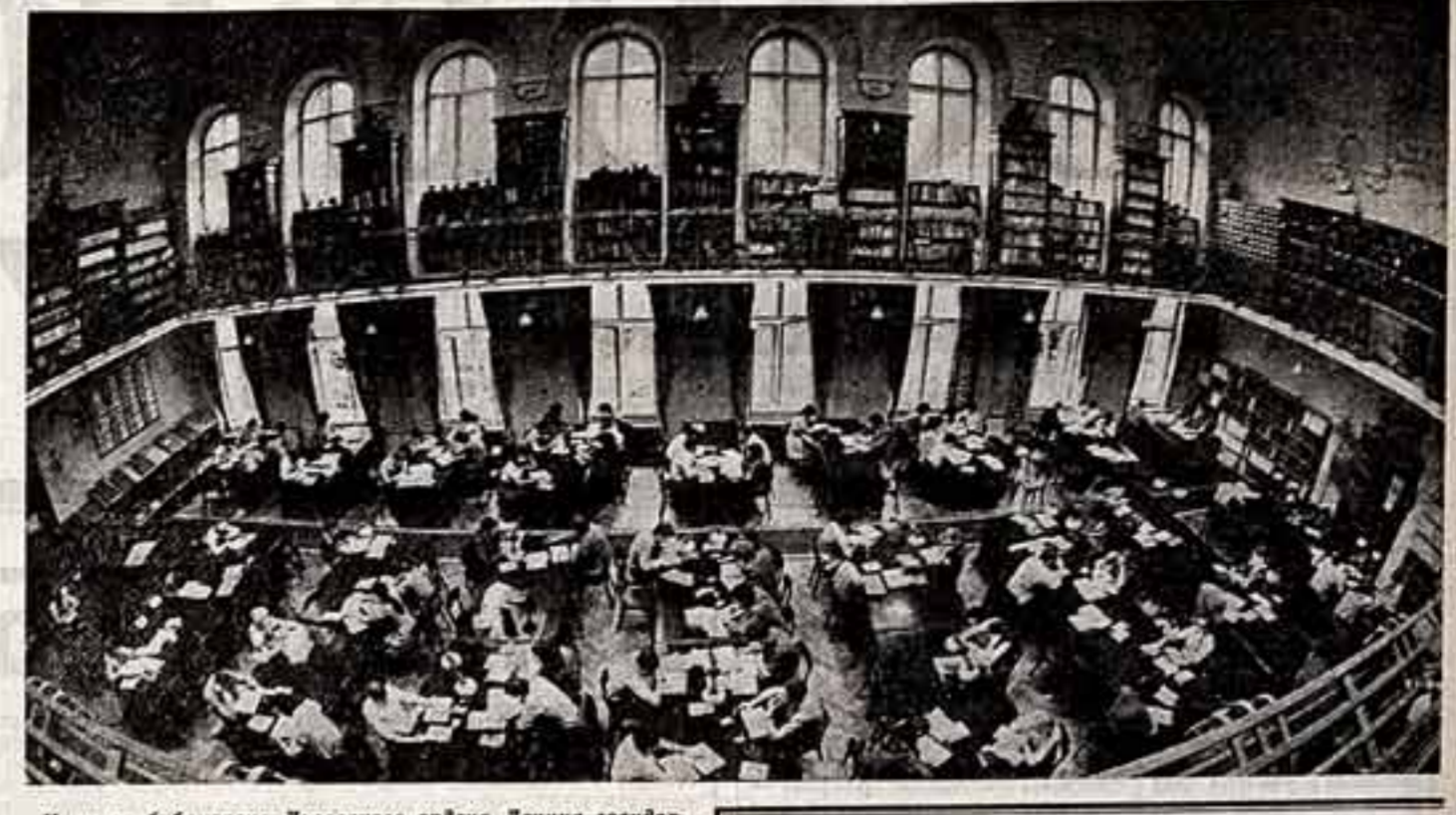
Научная библиотека Львовского ордена Ленина государственного университета имени И. Франко в сентябре отмечает свое 375-летие. В фондах библиотеки 2 млн. 850 тыс. экземпляров учебной и художественной литературы на сорока языках.