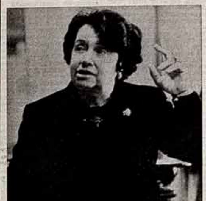
У К А З Президиума Верховного Совета СССР О присвоении звания Героя Социалистического Труда тов. Сац Н. И.

Документы и материалы юбилейного (1983 г.) пленума ЦК КПСС открыли перед художественной интеллигенцией страны огромные перспективы для дальнейшей плодотворной деятельности. Сегодня кинематографисты всех поколений, среди которых такое большое место занимает талантливая молодежь, на всех киностудиях страны ведут напряженную творческую работу. И есть все основания быть уверенными, что многие новые фильмы обогатят наш экран, будут отвечать тем высоким требованиям, которые предъявляют киноискусству Коммунистическая партия и советский народ.