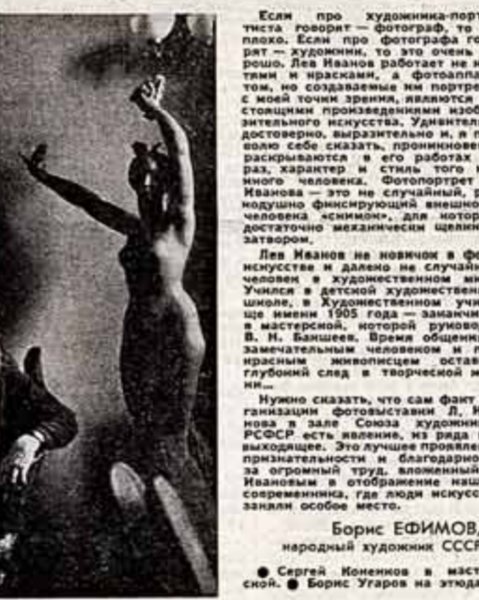
Борис ЕФИМОВ, народный художник СССР.