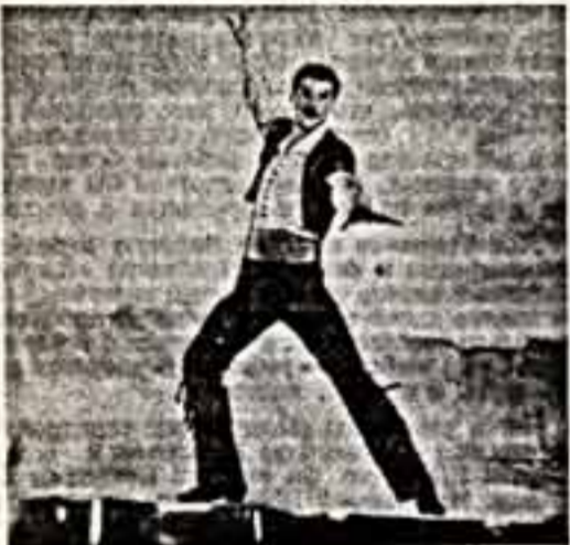
«Зимний вечер в Гаграх».

Очень простой, даже, можно сказать, примитивный треугольник, но атмосфера времени передается точно и разрабатывается автором без мелодраматических излишеств.