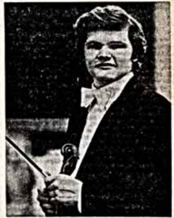
С. СЛОНИМСКИЙ.