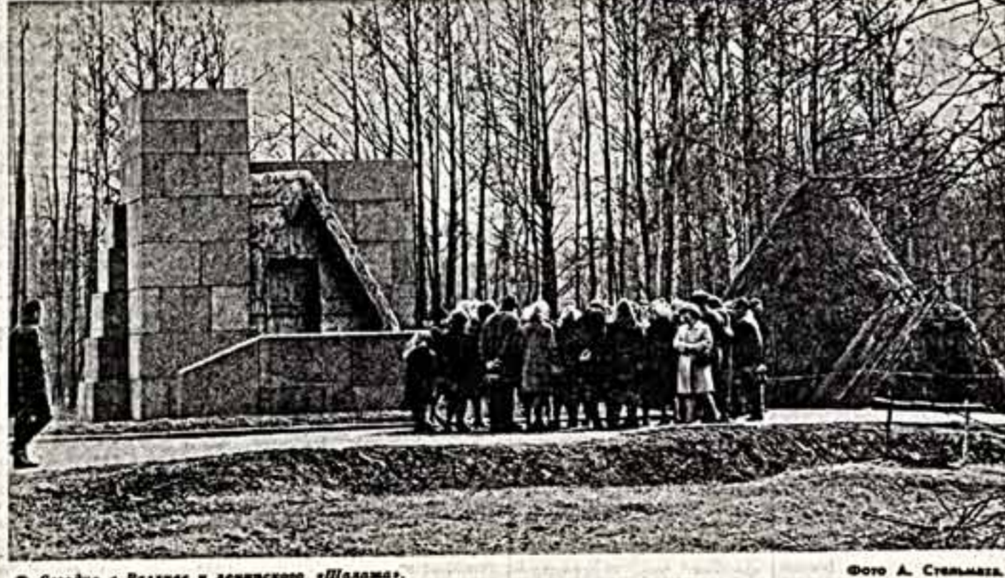
Сегодня в Равне у ленинского «Шалама».