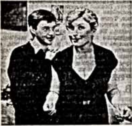
«Как молоды мы были».