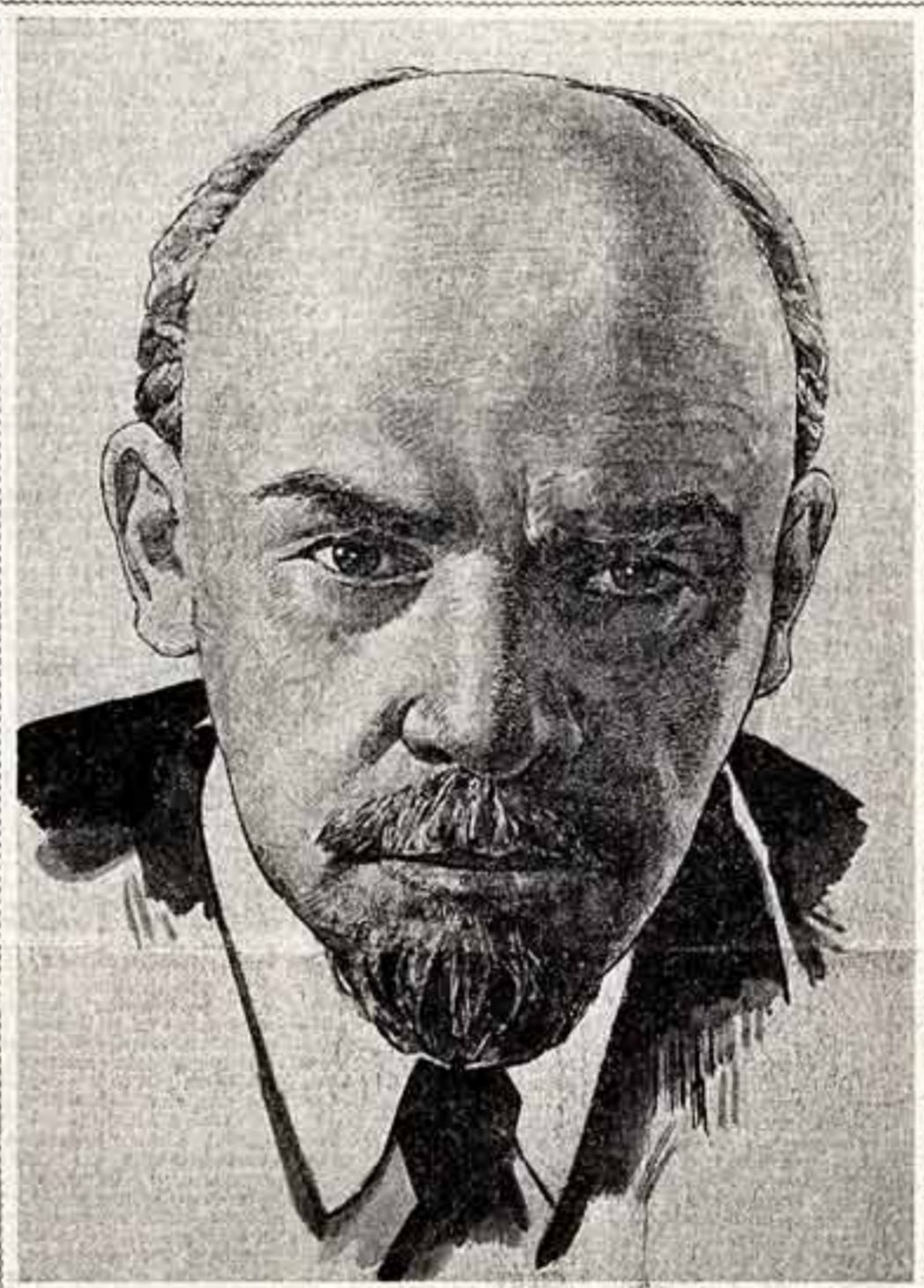
В. И. ЛЕНИН.

Деятели литературы и искусства, работники культуры! Создавайте произведения, достойные нашей великой Родины! Высоко несите знамя партийности и народности советского искусства! (из призывов ЦК КПСС).