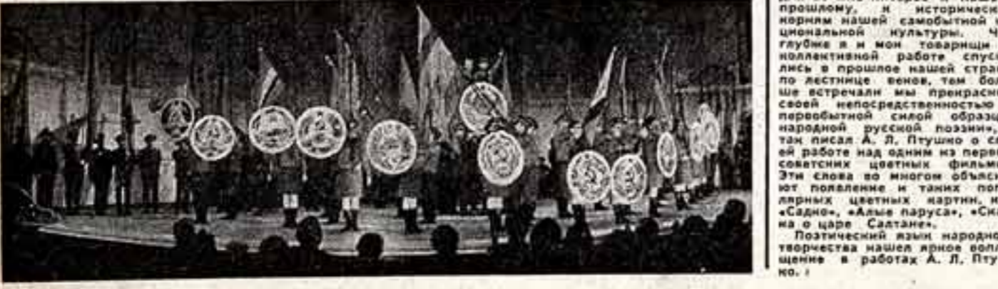
Выступление танцевальной группы.

На чемпионате СССР по фигурному катанию изничтожилась лидером в одиночном катании среди мужчин и в парном катании, Москвичом Евгением Семеновым, который в паре с Татьяной Тарасовой завоевал золотые медали. В паре с Татьяной Тарасовой завоевал золотые медали в парном катании, Москвичом Евгением Семеновым, который в паре с Татьяной Тарасовой завоевал золотые медали.