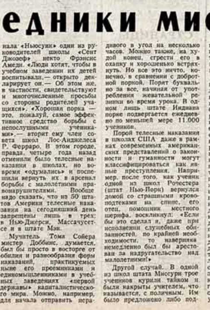
Беддинг Том Беддингтон Совер! Да, речь здесь идет именно о нем и его собратьях по несчастью.