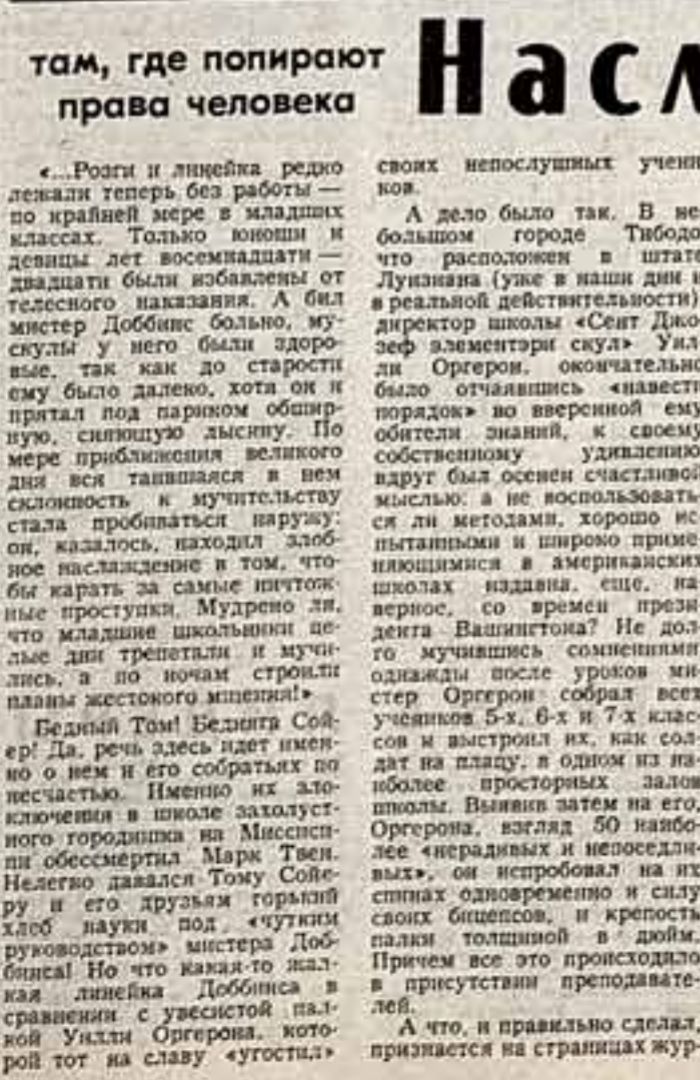
Беддинг Том Беддингтон Совер! Да, речь здесь идет именно о нем и его собратьях по несчастью.