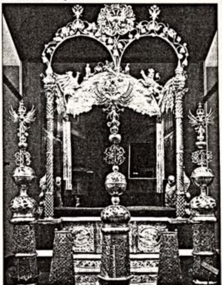
Трон двойной царей Ивана Алексеевича и Петра Алексеевича. Москва, мастерские Кремля, 1680-е гг.

Театру удалось избежать мизантропичности и сентиментальности в истории взаимоотношений героев. С психологической подробностью актеры рисуют характеры героев, пытающихся разобраться в своих чувствах. И если в первом акте ритм счастливо