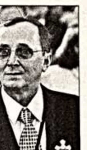
И. Бурляеву — 60

3 августа исполняется 60 лет актеру-режиссеру, президенту кинофорума "Золотой Витязь" Николаю Бурляеву. Если следовать цифрам трудового стажа, то Бурляев — ветеран ветеранов, поскольку заниматься начал в тринадцать лет. Будучи школьником, он уже работал в короткометражной картине студента Андрей Кончаловского "Мальчик и пугало". И нашел его начинающий режиссер оказался на улице, заметил на улице Горького. Золотому Кончаловскому подарили Тарковскому: увидел парня в модной футболке студента, пригласил в "Иваново детство". Интересно, что обе эти ленты получили в Венеции по "Льву": первая — бронзового (был в ту пору и такой), вторая — золотого. О роли Бурляева в "Иваново детстве" писал даже Жан-Поль Сартр.