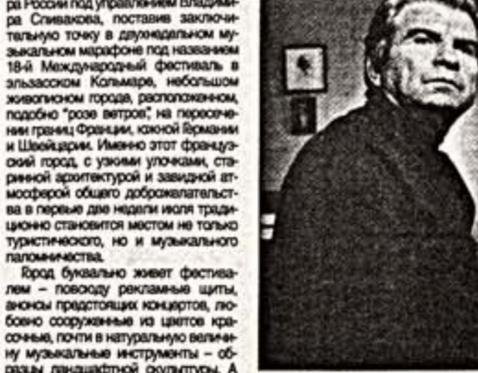
Э.Гилельс. 1984 г.

Состоялся 18-й Музыкальный фестиваль в Кольмаре