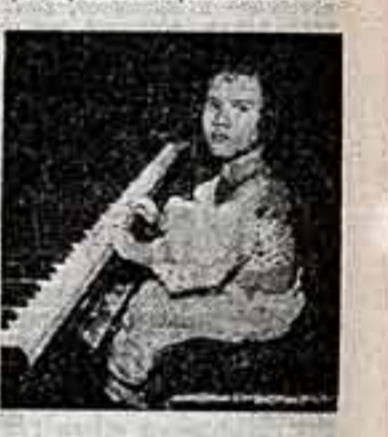
ин; слишком короткие ножки, не достигающие до педалей, милая привычка раскладывать на рояле еду и, что самое сложное, не прекращающиеся предложения о ее публичных выступлениях.