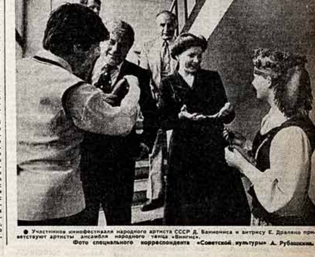
Участники кинофестиваля народного артиста СССР Д. Ваннонса и актрисы Е. Драченко присутствуют артисты ансамбля народного танца «Вингис».

Участники кинофестиваля народного артиста СССР Д. Ваннонса и актрисы Е. Драченко присутствуют артисты ансамбля народного танца «Вингис».