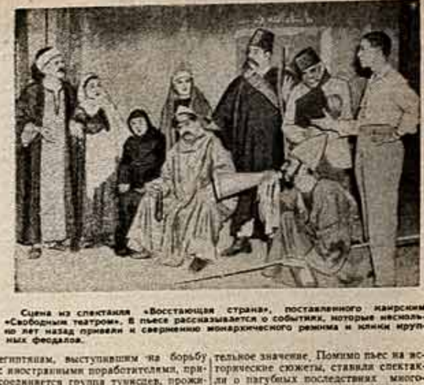
Сцена из спектакля «Возвращение стран», поставленного марксизмом «Свободным театром». В пьесе рассказывается о событиях, которые имелись на лет назад привели к современному монархическому режиму и жизни крупных феодалов.