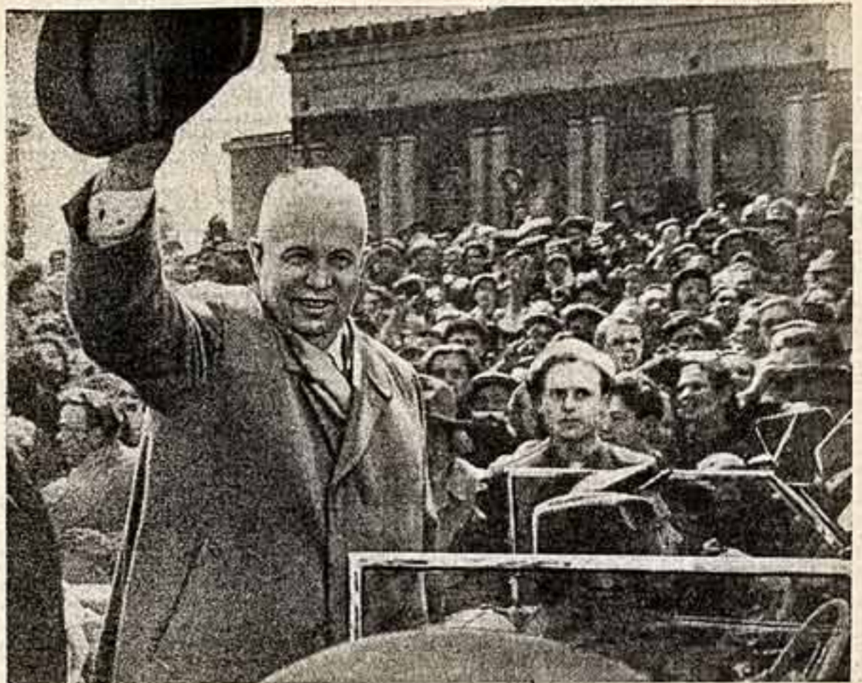
11 мая в Москве открылась Всесоюзная сельскохозяйственная выставка 1958 г. Первый секретарь ЦК КПСС и Председатель Совета Министров СССР тов. Н. С. Хрущев приветствует участников и гостей выставки.

тельства направлялись в павильон «Эстонская ССР», затем совершили поездку по выставке.