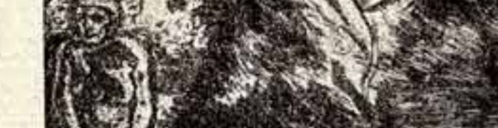
● Херлуф Бидstrup: «Победоносное поражение дяди Сэма в Индонезии».