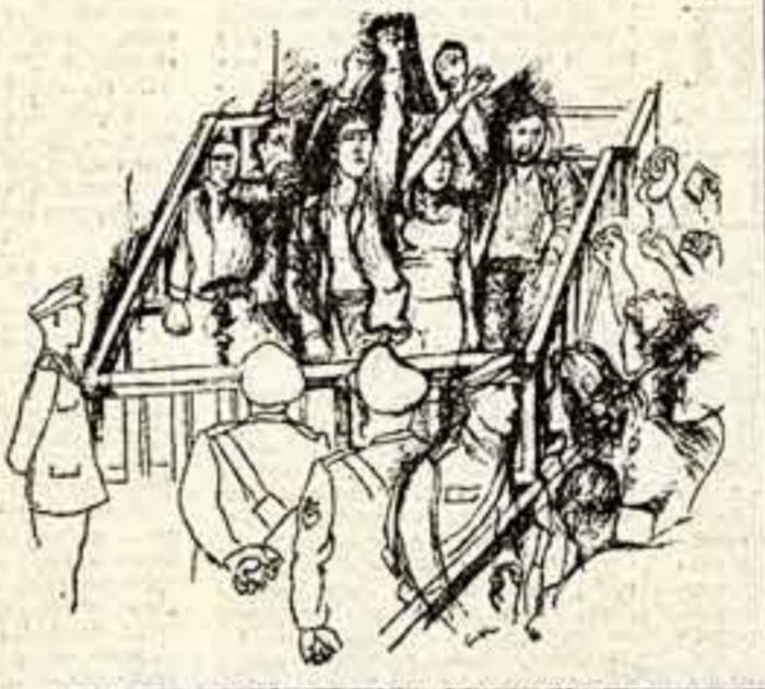
● Ренато Гуттузо: «Процесс против студентов».