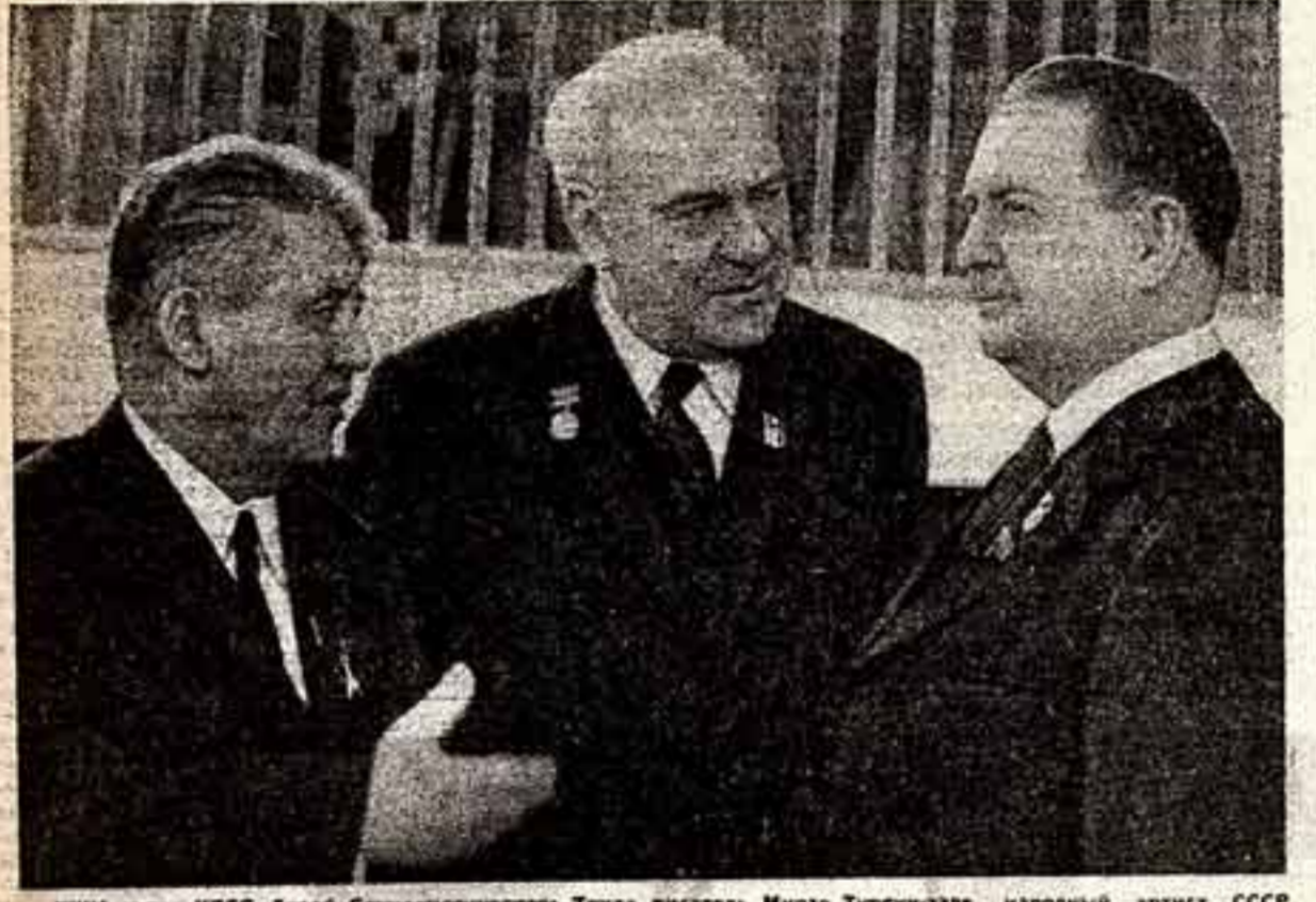
XXIV съезд КПСС. Герой Социалистического Труда писатель Мирзо Турсун-заде, народный артист СССР М. Царев и писатель Г. Мамнов.

Рассказ об успехах трудящихся Белорусии за последние годы, оратор основывался на перспективах развития промышленности и сельского хозяйства республики в новом пятилетии. Он подчеркнул необходимость