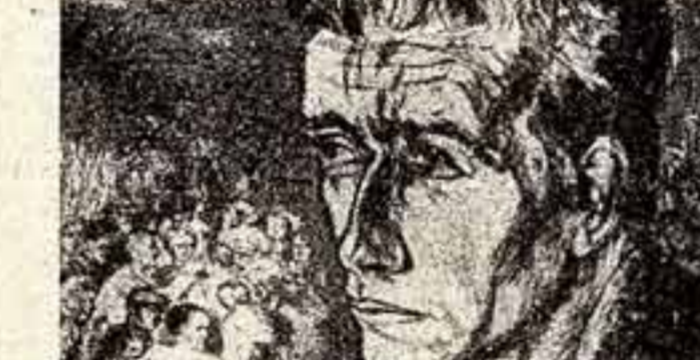
● Леа Грундиг: «Кристалл Ночью». 1938 год.