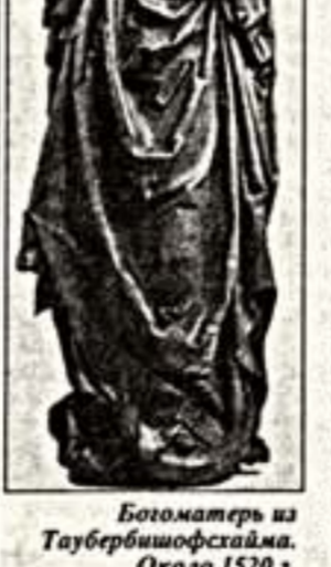
Богоматерь из Таубершифхойма. Около 1520 г.

В Музее изобразительных искусств им.А.С.Пушкина под таким названием открывается выставка деревянной скульптуры. Задача экспозиции - представить бытование в искусстве "вечных" евангельских образов и прежде всего Христа в его человеческой ипостаси. Представить в сопоставлении (которое может показаться неожиданным) немецкую и нидерландскую скульптуру Северного Возрождения XV - XVI вв. и нидерландскую скульптуру Перского края, относящуюся к XVIII и XIX вв. Нидерландско-немецкая скульптура выполнена крупнейшими мастерами своего времени, знакомыми с богословскими сочинениями, и является примером высокопрофессионального "ученого" искусства. Русская народная скульптура - пример искусства "народного", фольклорного, бесписьменного. Концепция выставки проявляется и в парадоксальном сопоставлении "средневекового" искусства Руси XVIII - XIX вв. с искусством европейского Возрождения хронологически предшествующего периода - XV - XVI вв. И все же главный пафос этой выставки не в сопоставлении культурных традиций, а в отношении их к современности. Каждая эпоха, каждая культура по-своему прочитывала евангелие, создавая свой образ Христа. Выставка будет проходить в рамках традиционных "Декабрьских вечеров Святослава Рихтера".