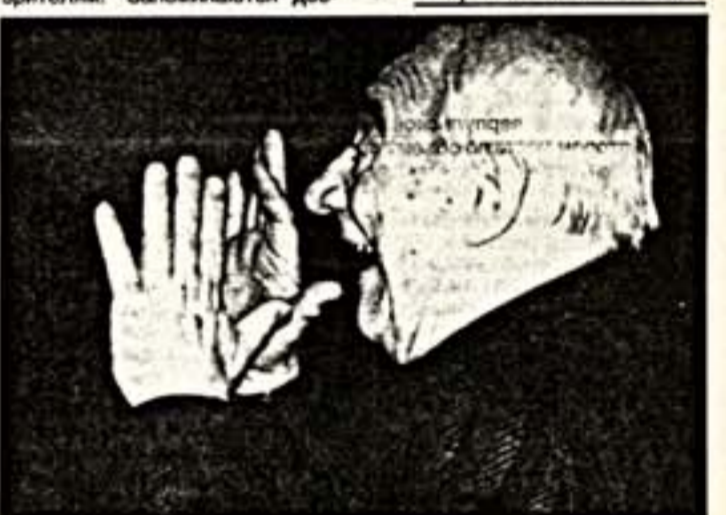
Это только не покажишь на респекции