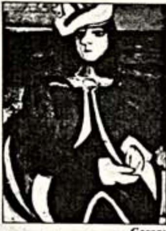
Слева: "Дама на палубе". 1980 г. Справа: "Автопортрет". 1978 г.