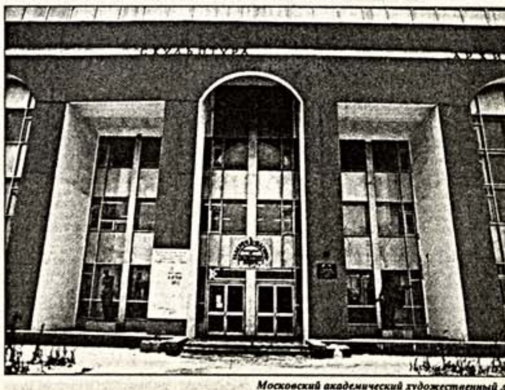
Московский академический художественный лицей

Эти были первыми - так называется выставка, которая открыта в залах лицея на Крымском валу. Представлено 300 работ ста учащихся тех первых лет существования лицея. Может быть, самостоятельность стиля, оригинальность манеры письма, мощью и темпераментом они еще не обладали, но поражают их профессиональ-