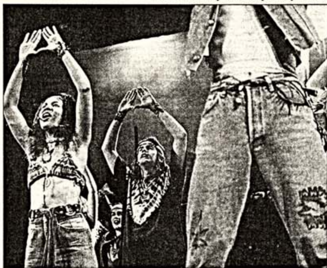
Сцена из спектакля "Графиня и другие"