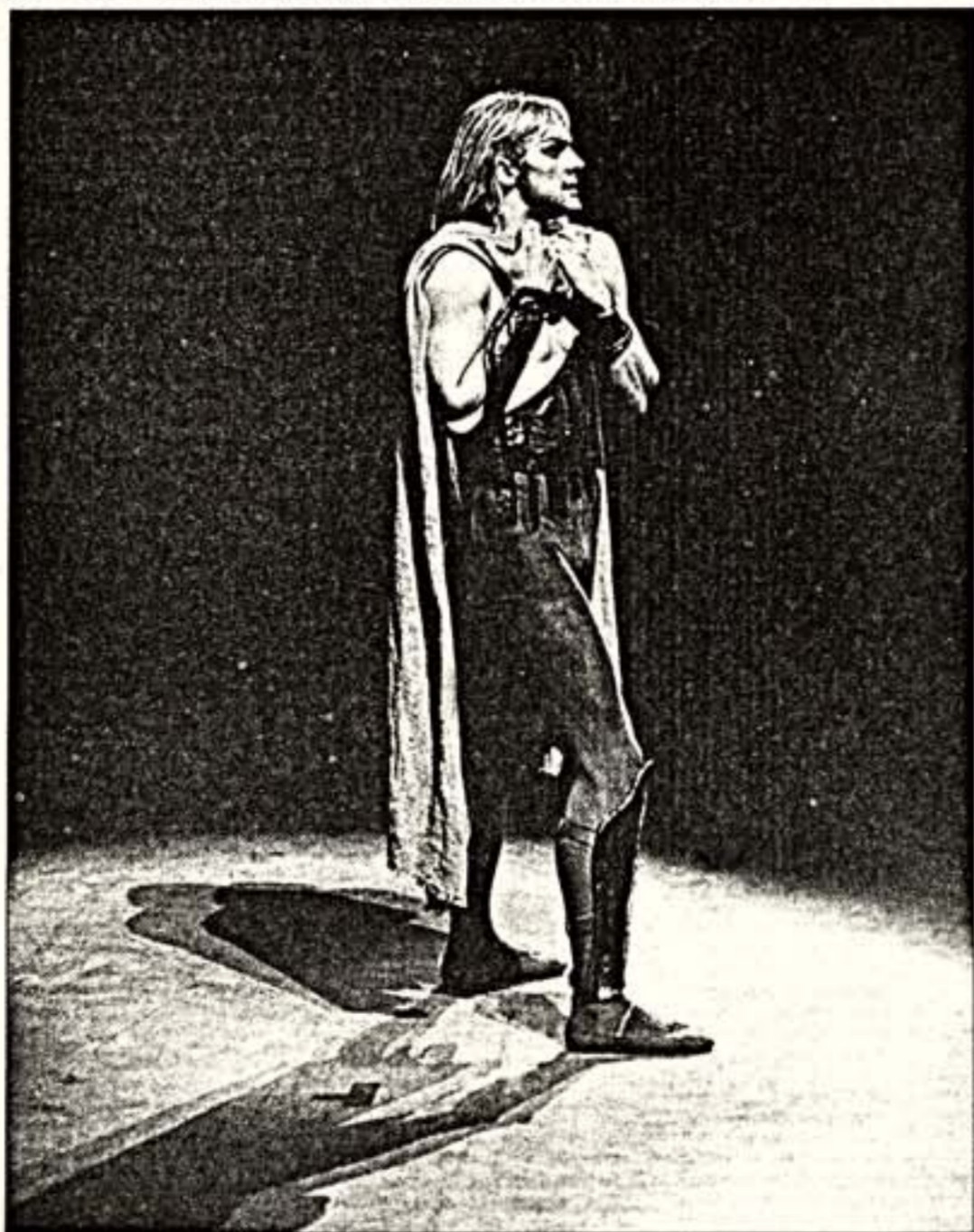
А.Годунов в балете "Спартак"