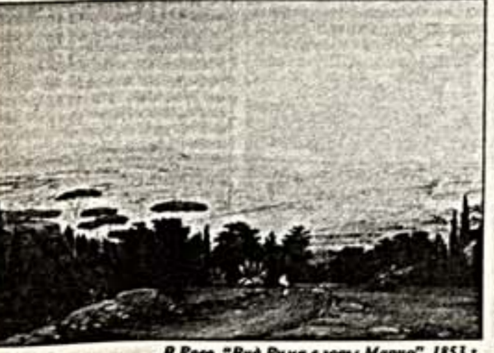
В.Равв. "Вид Рыла с горы Марно". 1853 г.

Художественные богатства из Нижнего Тагила в ГТГ