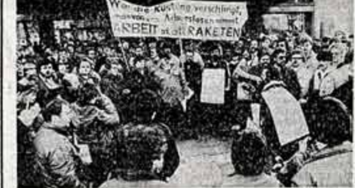
Трудящиеся ФРГ все настойчивее выдвигают требование сократить государственные ассигновки на милитаристские приношения...