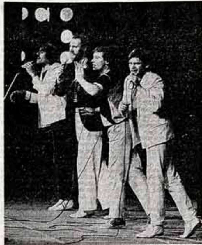
В концертах звезд польской эстрады приняла участие солистка группы «ВОКС» — лауреат международных песенных фестивалей.

Во Всероссийском театральном обществе состоялась творческая встреча на тему «Идейно-творческое воспитание молодежи...»