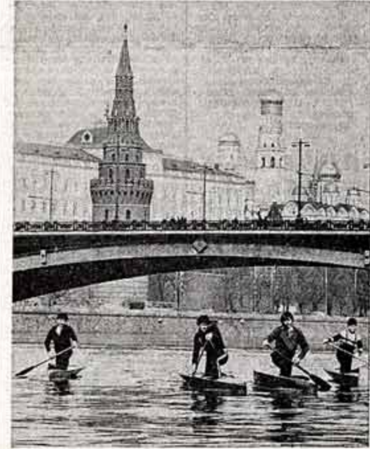
В Москву пришла весна.