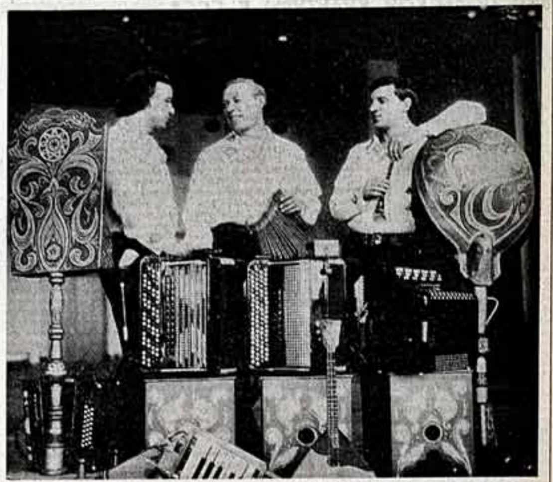
ЗВУЧИ, МОЯ БАЯН. Три года они выступают вместе, каждую неделю музыканты, объединенные в ансамбль «Искрилки»...