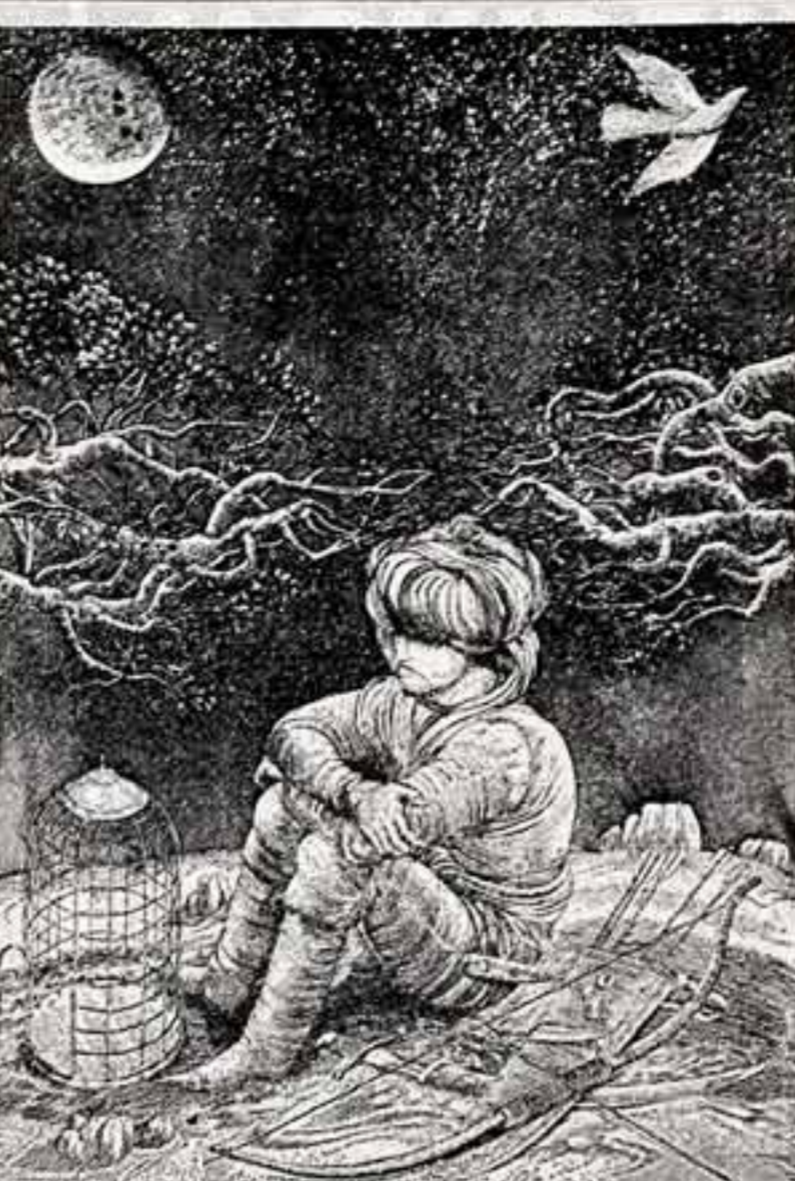
Садиковский боловай, которую изданию экспериментально-графический отдел при Издательстве литературы и искусства имени Гафура Гуляма.