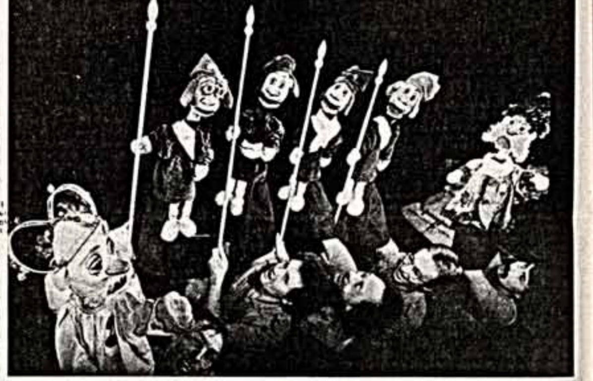
Горьковский театр кукол показал во Франции, на Международной фестивале кукольных театров, волшебную сказку «По ученью великому». В репертуаре одного из старейших коллективов страны 28 спектаклей для детей и 6 для взрослых.