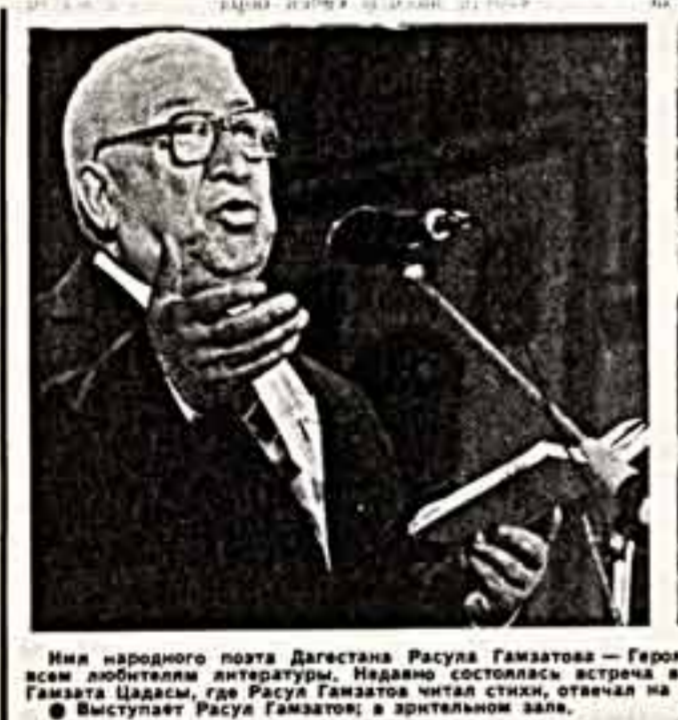
Мия народного поэта Дагестана Расула Гамзатова — Героя Социалистического Труда, лауреата Ленинской премии — известно всем любителям литературы.

19 октября супруга Президента Бразилии Марии Машейра Сарней продолжила знакомство с достопримечательностями Москвы.