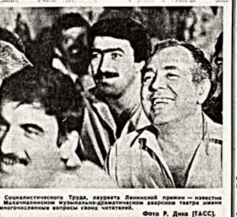
Имя народного поэта Дагестана Расула Гамзатова — Героя Социалистического Труда, лауреата Ленинской премии — известно всем любителям литературы.