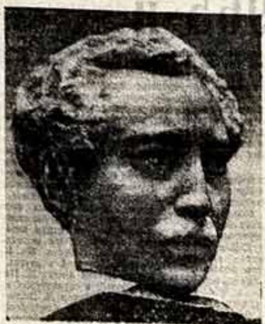
Х. НАУРБАЕВ. Портрет Самыра Сейфуллина.