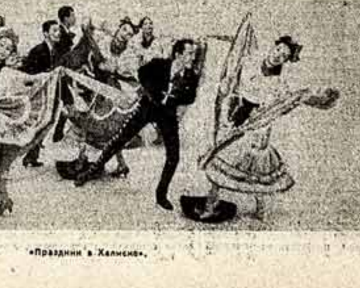
«Праздник в Халенце».

Встреча с оптимистическим искуством одного из музыкальных народов мира доставила многим любителям музыки большое удовольствие.