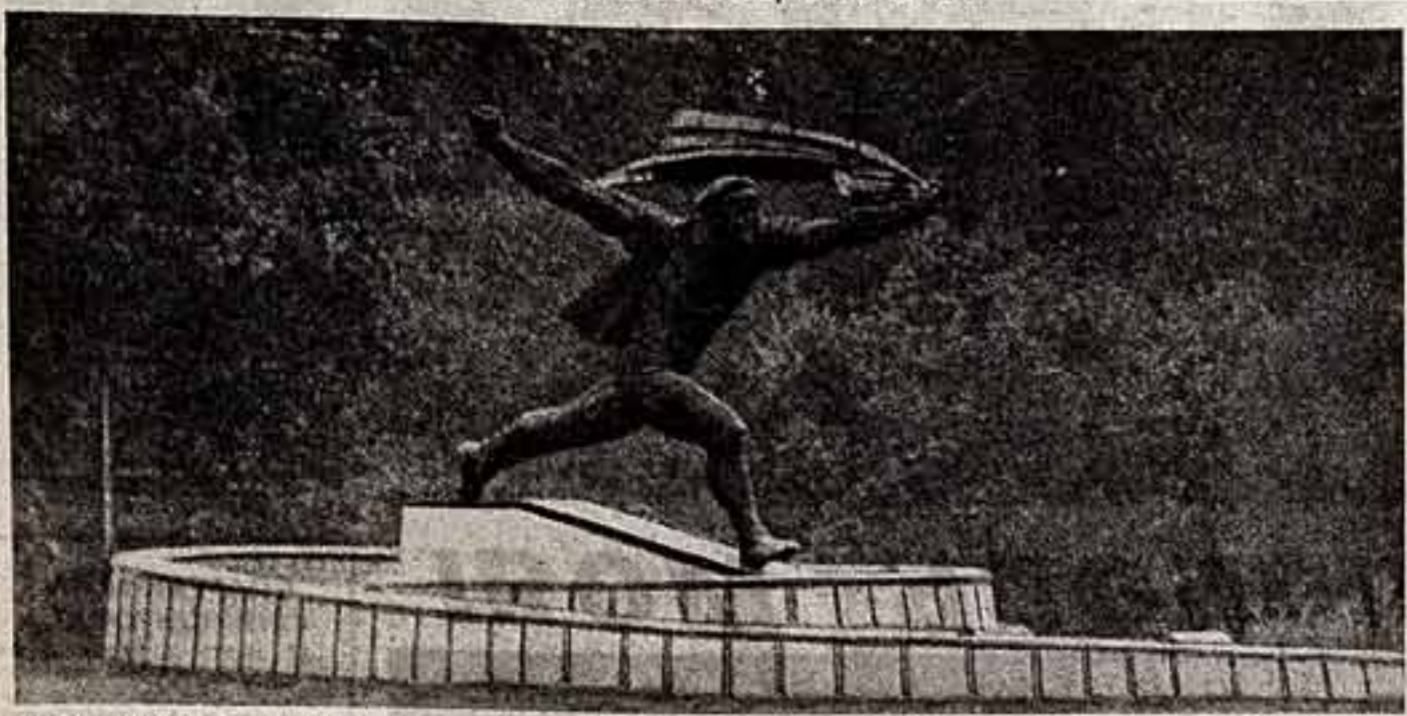
Неудержимый порыв, целеустремленность и страстный призыв к действию — такое один из памятников Буддешта. Он установлен в столице в честь Венгерской советской республики 1919 года.

Скульптор И. Каш взял за основу своего монумента знаменитый плакат тех славных дней, на котором изображен в динамичном разгоре революционный матрос с красным знаменем в руке.