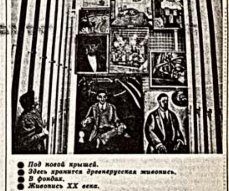
● Под новой крышей. ● Здесь хранится древнерусская живопись. ● В фондах. ● Живопись XX века.