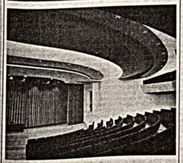
● Вестибюль конференц-зала. ● В компьютерном центре. ● Конференц-зал.