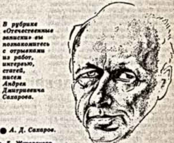
Рис. Б. Жутовского.