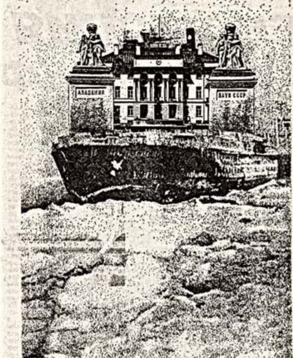
Здание Академии наук СССР