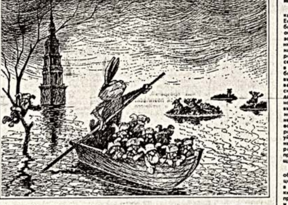
По законам «Красной книги». Рис. В. Чижикова.

В редакцию поступили первые работы на конкурс «Ура, культура!», объявленный нашей газетой 31 марта с. г. и международным «Центром юмора» (советское отделение Федерации европейских карикатуристов).