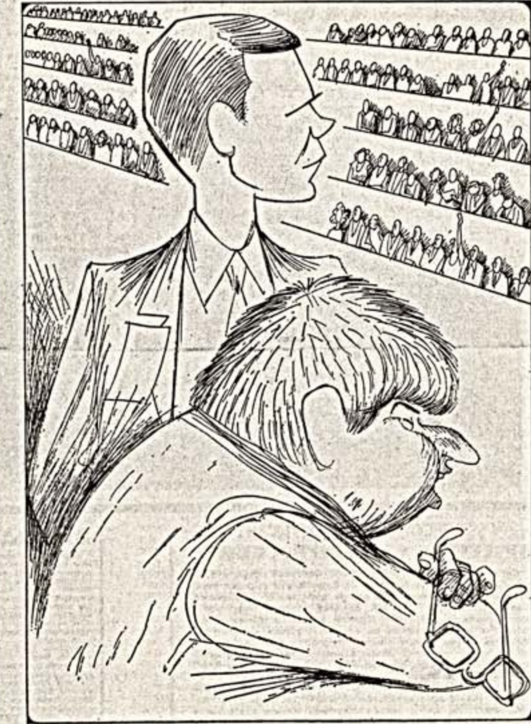
«Неформальным» портрет в интерьере Моссовета — Г. Попов и С. Станкевич. Дружеский шарж В. Чижикова.

— В одной из передач ЦТ «Актуальное интервью» слушатели такие высокопарные выражения: «он проявил высокую партийность!», и примарно через две минуты следую-