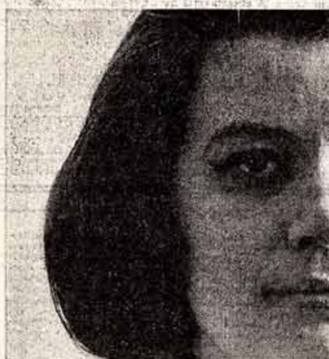
Народная артистка РСФСР Елена Образцова — солистка оперы Государственного академического Большого театра Союза ССР.