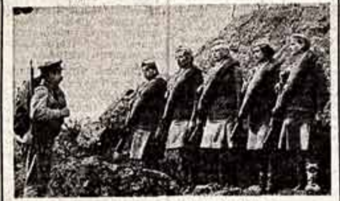
Кадр из фильма «А зори здесь тихие...»