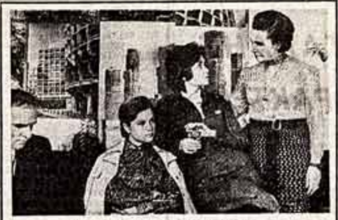
Кадр из фильма «Любить человека».