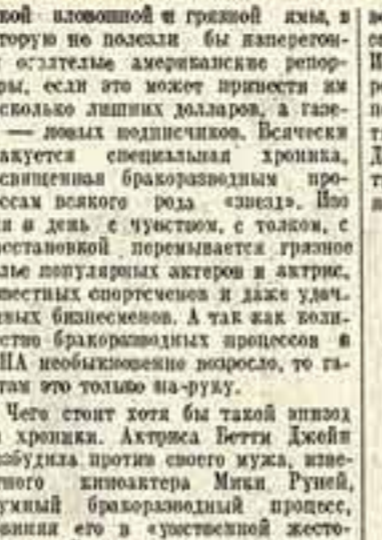
«Чек или ФБР» Р. Г. Валова.

Еще большей бесперебойностью отличается американская пресса, давая распространять остатки совести и здравого смысла в погоне за сенсацией любого сорта и качества. Нет