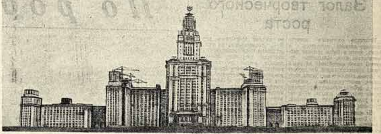
За последние годы в печати «Советское искусство» было опубликовано ряд статей, посвященных проблеме ансамблевого строительства. Высокая квалификация добросовестной и творческой работы по созданию ансамбля — это не только искусство, но и искусство жизни.

Л. РУДНЕВ, действительный член Академии архитектуры СССР