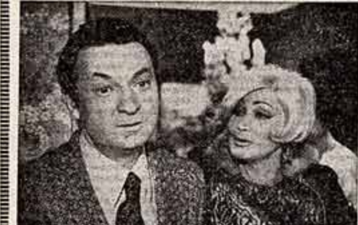
● В фильме «Большой аттракцион» заняты М. Менделеев и Г. Вицин.