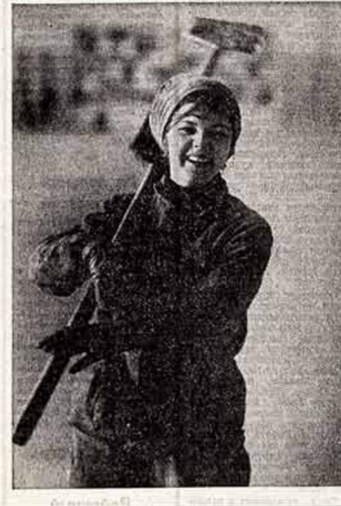
ФОТОКОНКУРЕ ● И. КОШЕЛЬКОВ, «Пятнадцатая симфония (Д. Д. Шостакович)». ● В. ПОЗДНЯК, «Важные зоры». ● А. ГАЛЛОЗА, «Веселая профессия — жалар».