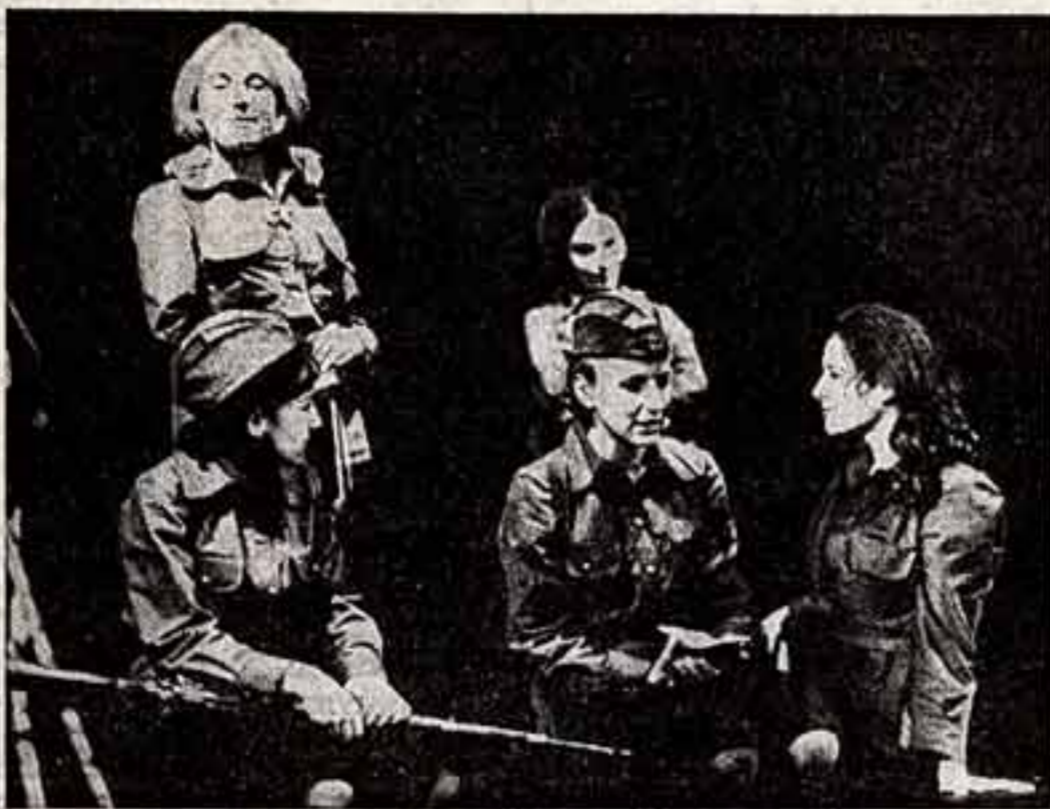
ЧЕХОСЛОВАКИЯ. На сцене драматического театра в Кладно поставлена пьеса советского драматурга Бориса Васильева «А зори здесь тихие...». Зрители тепло приняли спектакль.