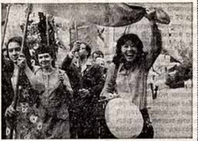
● Японская актриса Комаки Курихара (на снимке она — справа) — исполнительница главной роли в кинофильме «Москва — любовь моя».