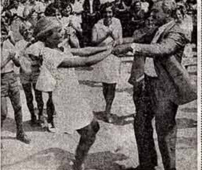
● В главной роли — С. Бондарчук («Такие высокие горы»).