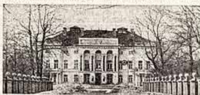
АКАДЕМИИ НАУК СССР — 250 ЛЕТ

Вновь избранным областным и краевым партийным комитетам предстоит обобщить накопленный опыт в мобилизации творческого потенциала художественной интеллигенции и многомиллионной армии работников культуры при решении практических задач коммунистического строительства и организовать действенное идеологическое и нравственно-психологическое обеспечение ударного труда советского народа в определяющем году пятилетки.