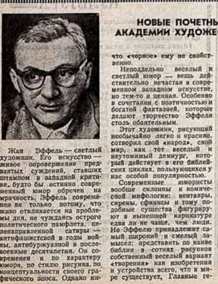
Жан Эффель — светлый художник. Его искусство — живое орошение предвзятых суждений, ставших штампом в западной критике, будто бы истинно современность юмор обрел и приобрел. Эффель современен не только потому, что живо откликается на проблемы дня, не нуждается остро политического памфлета, тенденциозной сатиры — антифашистской в годы войны, антикубинской в последние десятилетия. Он современен и по характеру юмора, по стилю рисунка, по концептуальности своего графического эпоса. Однако ин-

«Общественный совет южнокорейской США приступил к южнокорейскому режиссеру Томасу Гуттюресу. Ален — поставившему фильм «Воспоминания об отставке», премия за лучшую режиссуру и пригласил его принять в Союзные Штаты для ее получения. Однако государственному департаменту США отказался выдать южнокорейскому режиссеру въездную визу. Среди американских работников искусства этот грубый антикубинский выпад вызвал гневное осуждение. «Какое кощунство лицемерно, какое двуличие», — заявил в письме в газету «Вашингтон пост» актер столичного театра «Арена Студио» Теренс Курьер. «По какой логике, — спрашивает он, — мы должны извиниться перед ним, а не наоборот? Он не впустил в страну режиссера, который его поставил! Я хочу извиниться перед южнокорейским режиссером», — пишет Курьер, — за это бездумное, антидемократическое нарушение элементарных принципов свободы и культурного обмена». В. ВАШЕДЧЕНКО, корр. ТАСС — для «Советской культуры», ВАШИНГТОН.