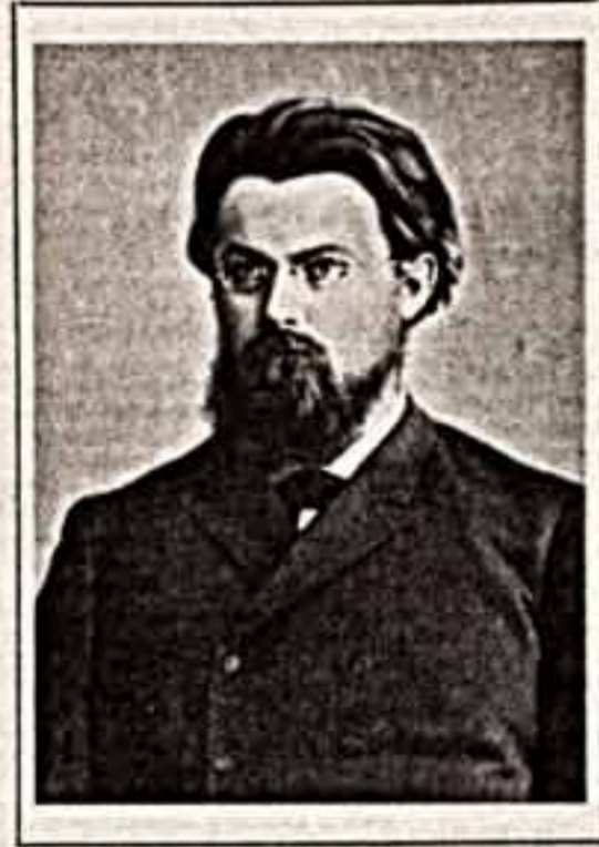
В. И. ВЕРНАДСКИЙ

6 ноября. Очень смутно и тревожно за будущее. Вместе с тем и очень ясно чувствую силу