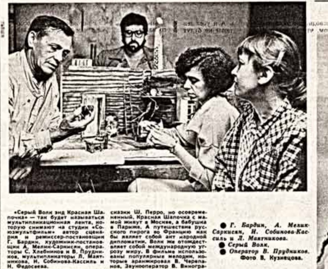
«Серый Волк энд Красная Шапочка» — так будет называться мультимедийная лента, которую снимает на студии «Союзмультфильм» автор сценария и режиссер-постановщик Г. Бардин, художник-постановщик А. Мелик-Саргисян, операторы С. Хлебников и В. Прудников, мультипликаторы Л. Мелитинова, Н. Собина-Касилья и Н. Федорова. Закулисный оператор — это будет мюзикл на сюжет сказки Ш. Перро, но современнейший. Красная Шапочка с мамой живут в Москве, а бабушка в Париже. А путешествие русскоязычного героя по Франции мы являем собой акт народной дипломатии. Волк же отойдет в сторону, оставив международную угрозу миру. В фильме использованы популярные мелодии, кинофильмы, мультипликация В. Черепанова, звукооператор В. Виноградов.