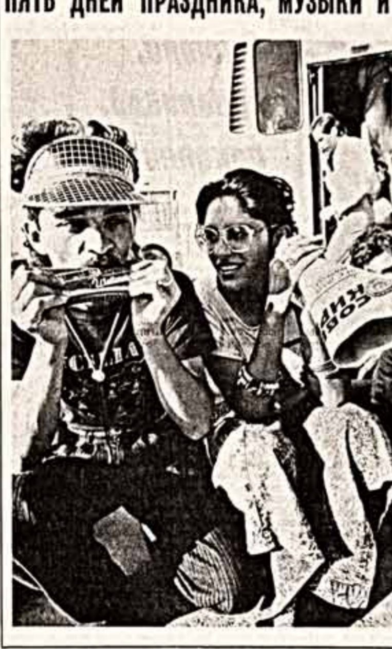
Киргизская ССР.