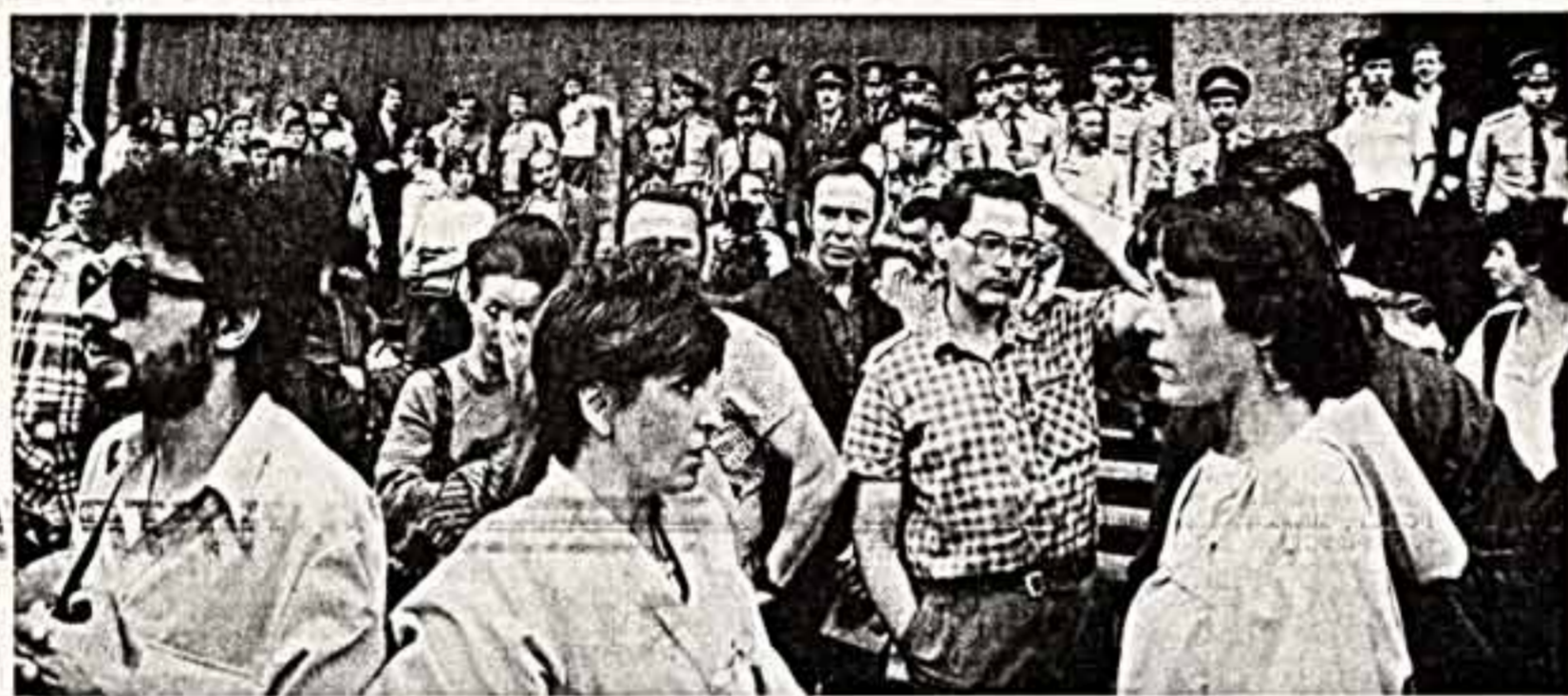
● Споры, раздумья, дискуссии...

Теперь о том, что нас тревожит. Представители «ДС» полностью игнорируют утвержденные правила о порядке проведения митингов. В большинстве случаев их несанкционированные выступления сопровождались лозунгами и плакатами клеветнического характера, распространением листовок антисоциалистического содержания. Экстремистами из этой организации 21 августа спровоцированы события в сквере на Тверском бульваре, о которых уже писала пресса. В тот день там собрались члены «ДС» и других группировок с целью проведения митинга, приуроченного к 20-й годовщине ввода войск четырех стран Варшавского Договора в Чехословакию. Несмотря на обоснованный запрет Моссовета на проведение митинга, обращения представителей ГУВД с разъяснением положения Указа Президиума Верховного Совета СССР от 28 июля 1988 года «О порядке организации и проведения собраний, митингов, и предупреждения о необходимости прекратить несанкционированные мероприятия, собравшиеся отказались покинуть место собрания. Руководители «ДС» попытались начать митинг. При этом вели себя чрезвычайно агрессивно, провоцировали мили-