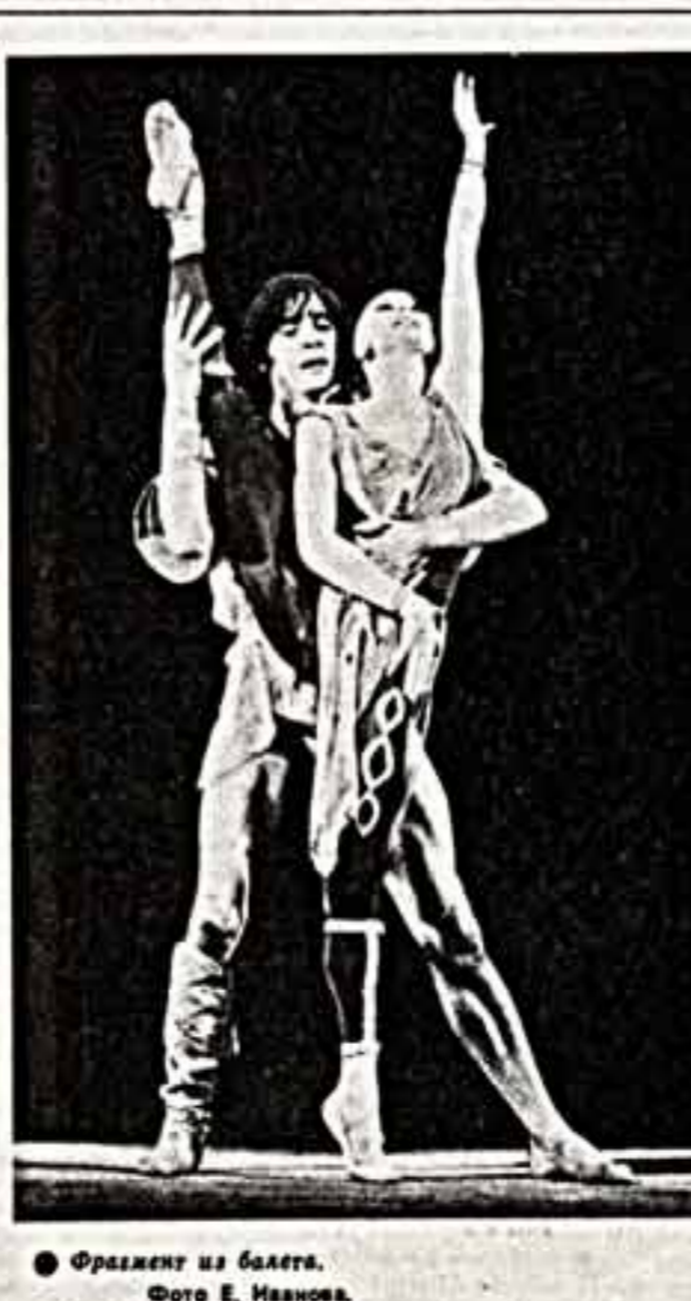
Фрагмент из балета.

Жанр спектакля Тюменского областного театра кукол «Трагическая опера» по одноименной пьесе Бертольта Брехта — Фарс-опера. Постановщик Федор Шевкин соединил экспрессивную резкость, остроту, эмоциональную обаятельность пьесы с мотивами рока, динамикой современной эстрады. Ему помогла в этом рок-группа «Прогресс» под руководством Н. Швайкина и Ю. Коротковича, осуществившая аранжировку музыки Курта Вейля.