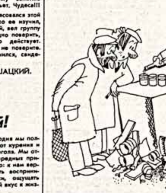
Рисунок Б. Боссарта.

А. ИСАЕВ, Л. ЗАГРЕБНА, А. КОРОБЕЙНИКОВ и другие.