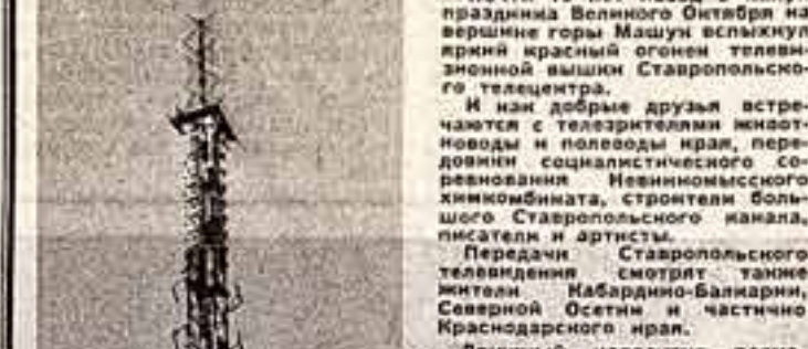
Почти 15 лет назад в канун праздника Великого Октября на вершине горы Машу вспыхнул яркий огонь телевизионной вышки Ставропольского телецентра.

Второй полклетки радиотелецентра уже рад имеет высокое звание — коммунистический. Непрерывно совершенствуют свое мастерство, инженеры и техники добиваясь устойчивого технического уровня телевизионных передач.