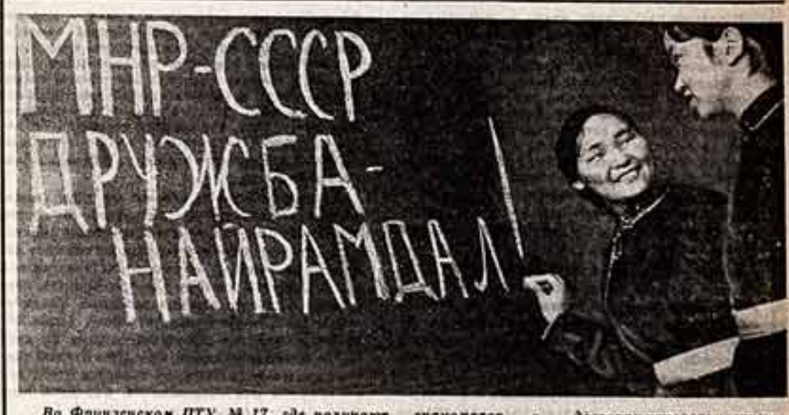
Во Фрунженском ПТУ № 17, где получают профессию бригадир мастера по пошиву мужской и женской одежды, участв. на родину высококвалифицированными специалистами. Среди них — учащиеся по руководству опытных преподавателей. В свободное время монгольские девушки знакомят с достопримечательностями Фрунжен, посещают музеи и выставки, занимаются спортом. Через два года они вернутся на родину — в Монголию. Вместе с ними возвращаются киргизками, русскими, украинками — они занимаются по руководству опытных преподавателей. В свободное время монгольские девушки знакомят с достопримечательностями Фрунжен, посещают музеи и выставки, занимаются спортом. Через два года они вернутся на родину — в Монголию. Вместе с ними возвращаются киргизками, русскими, украинками — они занимаются по руководству опытных преподавателей. В свободное время монгольские девушки знакомят с достопримечательностями Фрунжен, посещают музеи и выставки, занимаются спортом. Через два года они вернутся на родину — в Монголию. Вместе с ними возвращаются киргизками, русскими, украинками — они занимаются по руководству опытных преподавателей. В свободное время монгольские девушки знакомят с достопримечательностями Фрунжен, посещают музеи и выставки, занимаются спортом. Через два года они вернутся на родину — в Монголию. Вместе с ними возвращаются киргизками, русскими, украинками — они занимаются по руководству опытных преподавателей. Первый урок русского языка. Слева направо: У. Жамалурсун и Г. Ямалурсун.