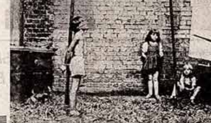
Клочки телевизора на другую программу и посмотреть телевизионный вариант «Белоснежки и семь гномов»...