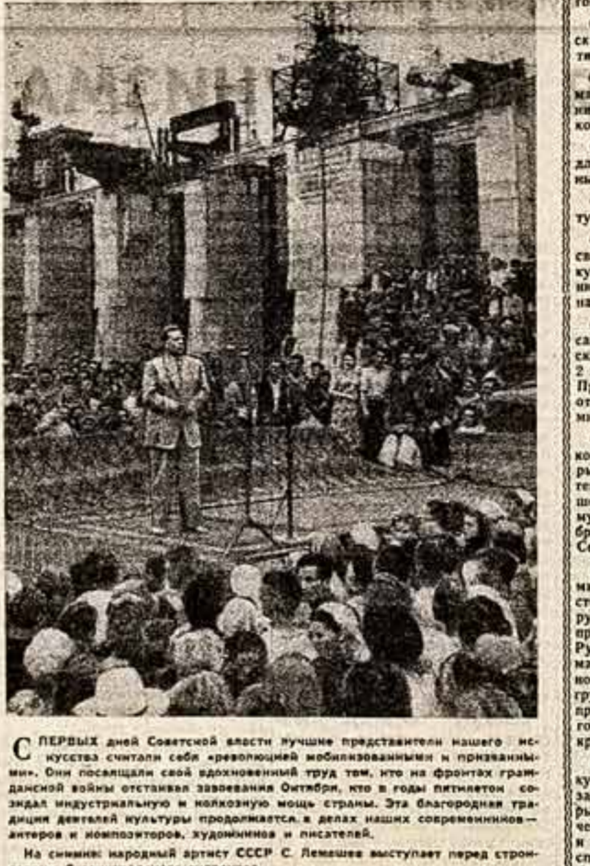
На снимке: народный артист СССР С. Лемашев выступает перед строителями Сталинградского гидроузла.

В нашей стране работает около 14 тысяч профессиональных клубов, свыше 25 тысяч библиотек с книжным фондом в 155 миллионов книг.