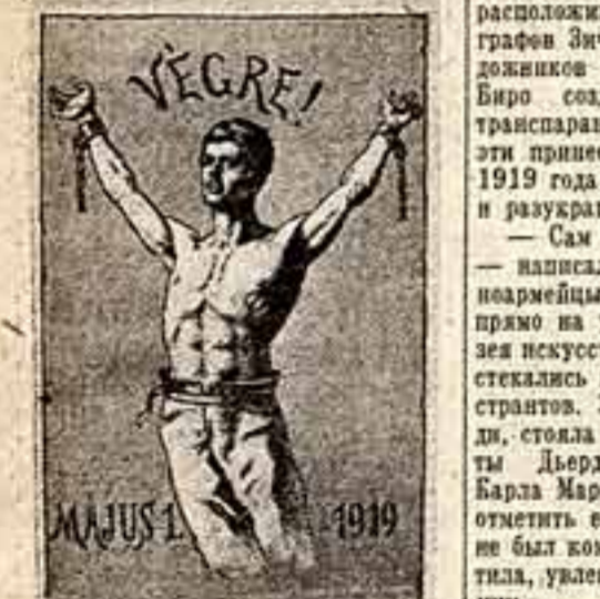
НАКОНЕЦ! Первомайский плакат 1919 года работы Рене Штейнера.

тятся о материальном положении художников, о возможности работы для них. Ста пятидесяти художникам были назначены государственные стипендии.