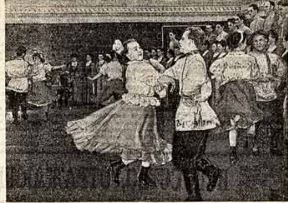
НЕСКОЛЬКО дней назад ленинградцы пришли в помещение Академической оперы, чтобы послушать юбилейный концерт самодеятельного русского народного хора областного комитета профсоюза работников культуры и коммунального хозяйства. На последнем Всесоюзном смотре художественной самодеятельности коллектив был признан лучшим хором профсоюзов СССР. Всего 10 лет прошло с той поры, когда небольшая группа девушек собралась в красном уголке обувной фабрики № 1, чтобы петь русские песни. А сейчас в хоре свыше восьмидесяти человек. Им разумно свыше ста старинных народных и современных песен, иррациональных хоромов, темпераментных русских плясок. А также произведения, как «Песня о партии», «Кленовый праздник», «Славься, матушка Россия», «Мы созданы в ансамбле». Их слоганами знаменителница из города Тиханки Л. Вальская, музыку написал художественный руководитель хора Л. Шимон. На сцене танцевальная группа хора исполняет «Вальсую мадам».

модельностью случайных людей, не обладающих ни специальными знаниями, ни педагогическими навыками. Ведь даже профессора актёра, а что и режиссера отнюдь не гарантируют правильной постановки работы в коллективе, если актёр или режиссёр не имеет ярко выраженных педагогических навыков, не знает и не пытается познать специфической природы самодеятельного искусства. блюдается тяга к самодеятельным коллективам со стороны юношей и девушек, входящих в бригады коммунистического труда. В художественной самодеятельности наша передовая молодежь ищет не только удовлетворения своих эстетически-творческих запросов, но и возможности повышения своего духовного роста, а значит, и качества своего труда. Такую тягу молодежи надо стимулировать всемерно. Чем больше будет людей с