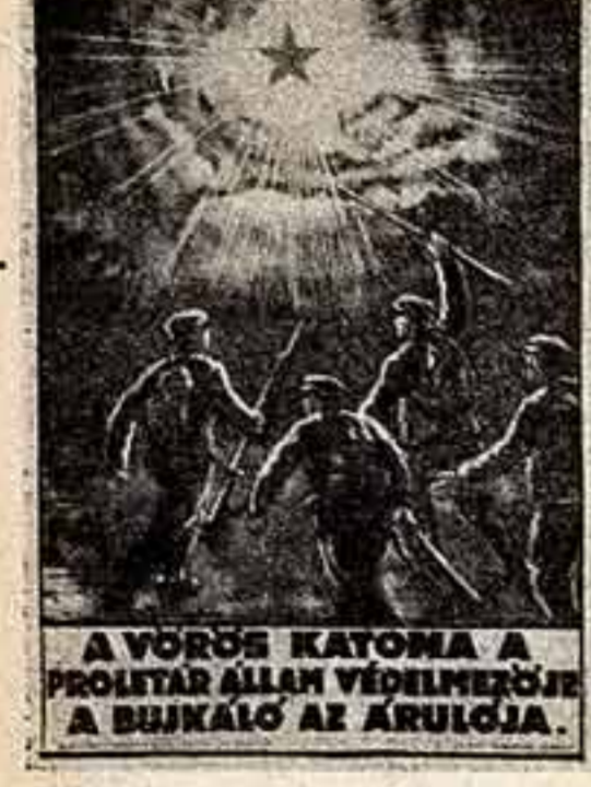
Красноармеец — защитник пролетарского государства в детстве — предатель! Планет работы Ивана ПОЯ.