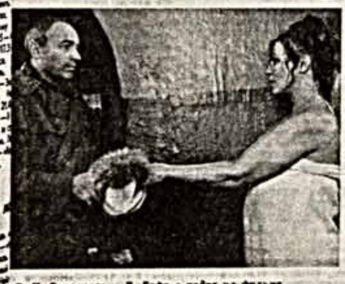
Н. Русалов и В. Гафт в кадре из фильма.