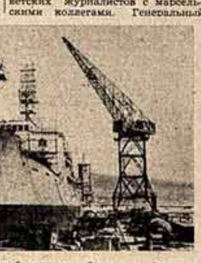
Пароход «Иван Павлов», построенный по заказу Советского Союза на верфях Ла Сьюта близ Марселя.

В Марселе нас пригласили в гости редакция трех городских газет: «Л'Эвюансаль», социалистическая — «Л'Эвюансаль», и органа крупных судовладельцев, никогда не отличавшегося симпатией к Советскому Союзу, — «Меридиональ». Политическое направление газет, однако, не слишком склалось на той обстановке, в которой состоялась встреча советских журналистов с марсельскими коллегами. Генеральный директор