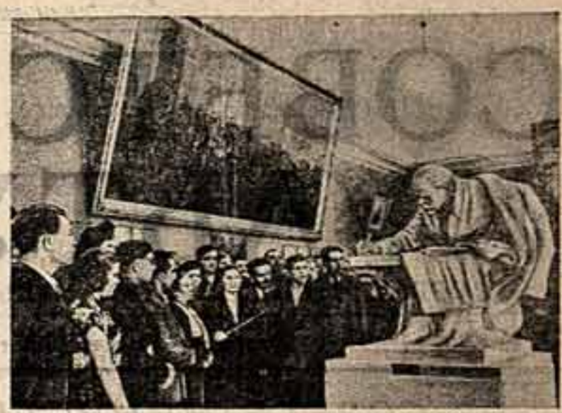
Центральный музей В. И. Ленина. На снимке: группа экскурсантов в одном из залов музея.

До скорого свидания, товарищи! ВЕЛГРАД, 13 мая. (По телефону).