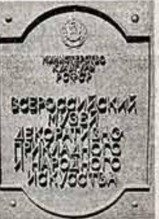
Постановление Совета Министров РСФСР о создании нового музея объявляет эти предприятия, а также народные промыслы и учреждения различных министерств и ведомств передавать нам лучшие образцы их художественной продукции. Мы можем также закупить произведений непосредственно у художников и народных мастеров, у коллекционеров, приобрести отдельные изделия через антиквариат. Но основа нашей коллекции создаст передачей экспонатов из фондов Министерства культуры РСФСР, Союза художников РСФСР, Министерства местной промышленности РСФСР и Государственного Исторического музея.

народного творчества, опираясь на художественные достоинства и последующую популяризацию заложат тот фонд эталонов, которым могут с успехом пользоваться современные художники. — Планы музея относительно персональных выставок мастеров позволяют надеяться, что мы увидим творчество тех virtuozов-одиночек, за которыми нет сегодня мощного промысла, но которые сами могли бы возлагать уникальное предприятие, будь у них ученики и последователи... — В планах наших выставок есть имена этих замечательных умельцев. А в задачу музея действительно входит оказание помощи народным мастерам. — В чем выразится такая помощь? — Кроме выставок, у нас есть возможность создать курсы повышения квалификации народных мастеров, пригласить специалистов-педагогов, предоставить в их распоряжение наши фонды. — Кстати, о фондах. Когда музей хрустальных, фарфоровых, текстильных предприятий начнет передавать вам дубликаты произведений заводских художников?