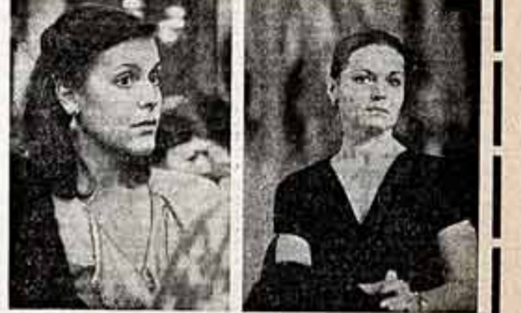
Актриса из Финляндии К. Еларанга.