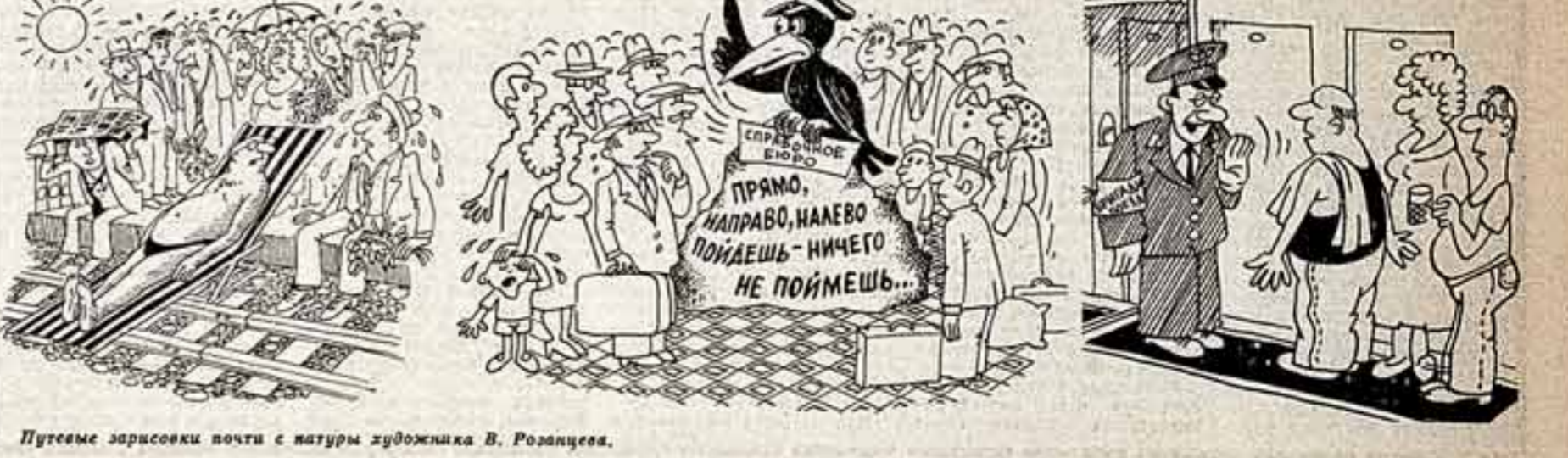
Путевые зарисовки почти с натуры художника В. Розолова.