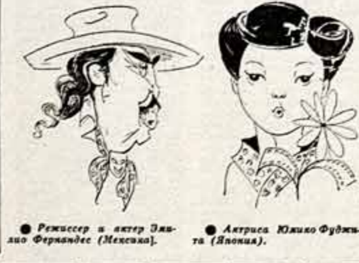
Актриса Юкико Фудзита (Япония).