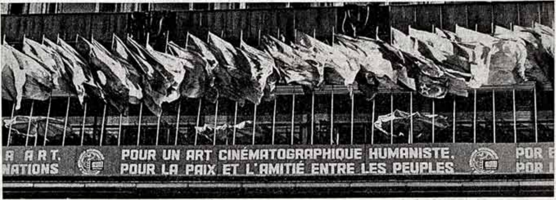
ЗАВЕРШАЕТСЯ XII Московский международный кинофестиваль.

В течение пятилетия в Монголию выедут на гастроли Академический театр им. Евг. Вахтангова, Центральный театр кукол, Академический русский народный оркестр имени Н. П. Осипова, Ленинградский мюзик-холл и другие. В Советском Союзе выступит Драматический театр им. Д. Нацагдоржа, ансамбль песни и танца Монгольской народной армии, кукольный театр, цирковые труппы, другие художественные коллективы МНР. Н. НЕТЕСОВ.