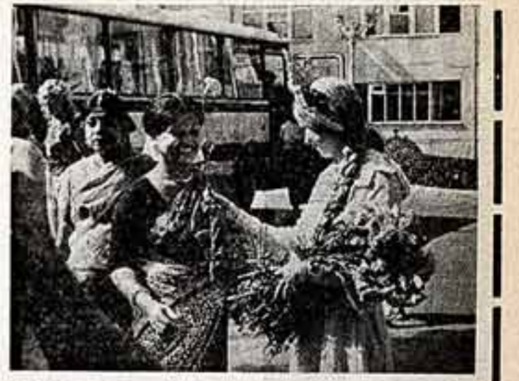
Цвета гостей фестиваля.

Вообще же в большом интересе отношусь к Советскому Союзу. Люблю быть в Москве и Ленинграде, в Киеве и Тбилиси, в Алма-Ате и Вильнюсе, Кишиневе и Хабаровске. Сейчас собираюсь записать пластинку, куда бы вошли 20 русских и советских песен. Надеюсь, они придут ко мне не исключим слушателем, так и исключительной советской публики.