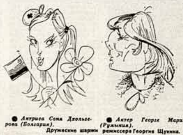
Актриса Сома Дзолаева (Болгария).