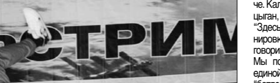
Музыкальный десант Государственного академического русского хора имени А.В.Свишчикова...

Впервые попавшая на "Гольфстрим" астраханская группа "Block Headz" – гагаринцы и "Орлята учатся летать".