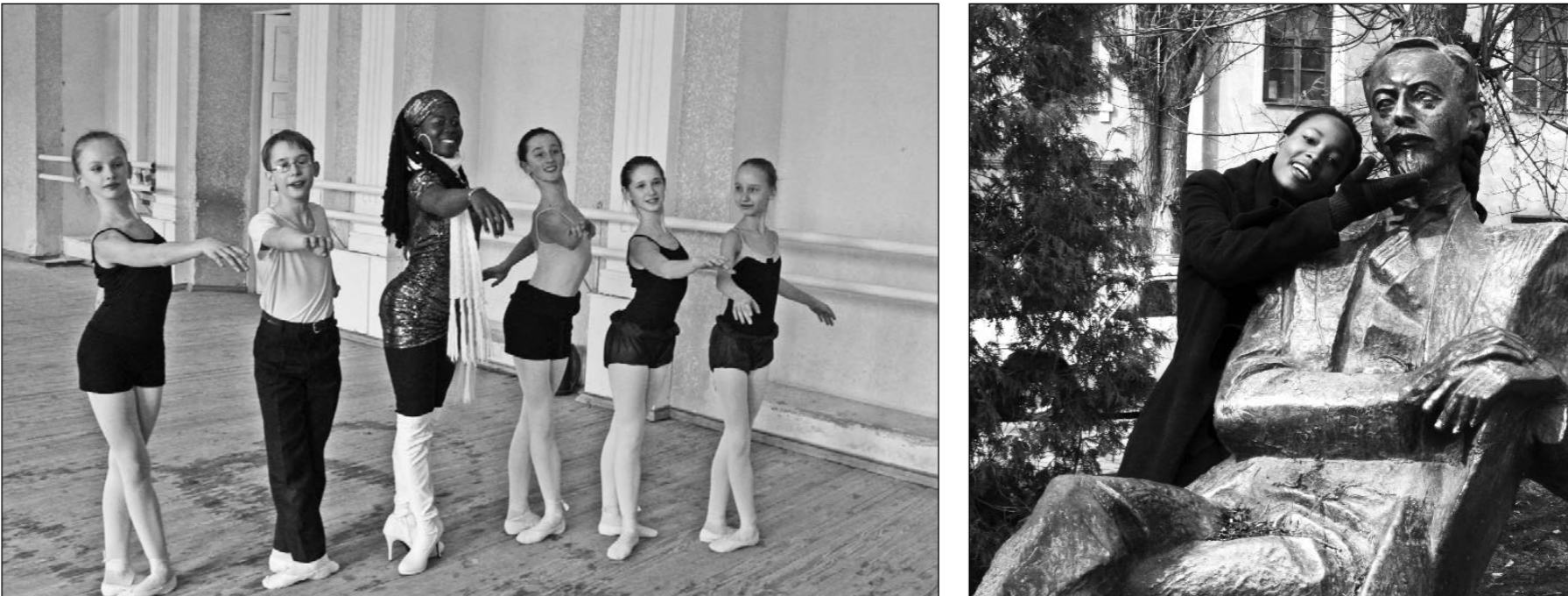
Липецк — Елец — Москва

И гастролируют по французской провинции, организуя "Свидание с Африкой". Назвать постановку Кубли танцевальной в чистом виде невозможно.