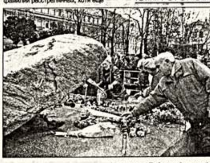
Митинг на Лубянской площади

Минувшая неделя прошла под знаком памяти жертв политических репрессий. За несколько дней до официального Дня поминовения, отмечаемого уже 25 лет 30 октября, по всей стране прошли акции, посвященные этому событию.