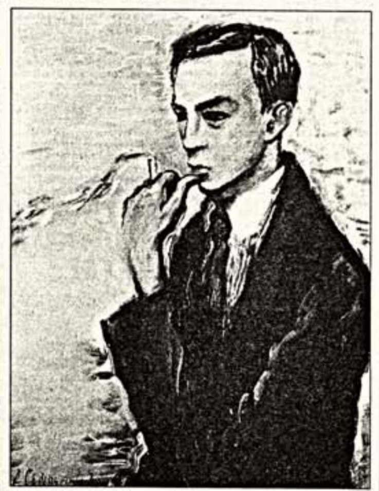
Вверху: А.Софронова. "Портрет А.Пумпянского", 1930 г. Внизу: "Ирина", 1919 г.

Антонина Софронова, чья выставку портретов показывает нынче "Ковчег", - художник известный и уже давно вошедший в анналы русского искусства.