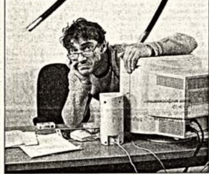
Кадры из сериалов "Директория смерти" (слева), "Камеюшка" (вверху справа), "Улицы разбитых фонарей" (внизу слева)

У меня, как и у любого продюсера, конечно, есть честолюбие, и сейчас я хочу один из главных соевых эгоизмов.