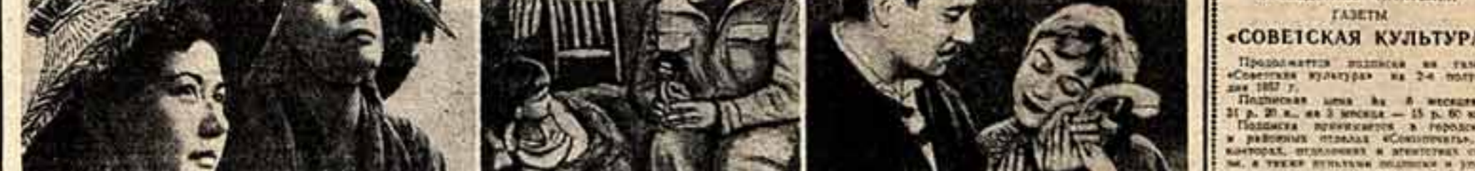
1. Кадр из японского фильма «Люди рисовых полей». 2. Кадр из югославского фильма «Долина мира». Артист Джон Китцмиллер в роли американского летчика. 3. Артистка Джульетта Мазина (Кадр) и артист Франсуа Перье (Оскар) в фильме «Ночь Кабирин».

Великолепное исполнение женской роли премия присуждена итальянской актрисе Джульетте Мазина, известной нам по фильму «Дорога». В картине Федерико Фелли