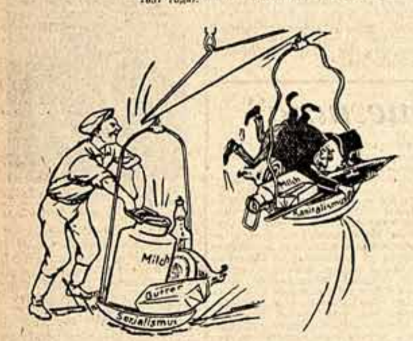
Карикатура художника ВАПЕР-РЕД. («Наше Дело»)

«...Мы считаем, что свершилось великое событие — достигли Союзные Штаты по производству водородных и ядерных бомб. (Из беседы Я. С. Хрущева с корреспондентом американской радиотелевизионной компании «Колумбия Бродкастинг Систем» 28 мая 1957 года.)»