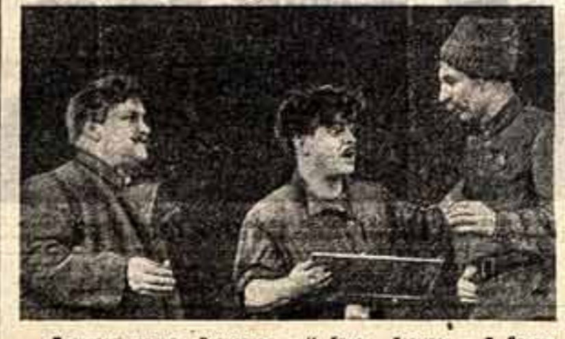
«Поднятая целина». Разметнов — К. Груди, Давыдов — Т. Лондон, Нагульнов — Е. Салин.