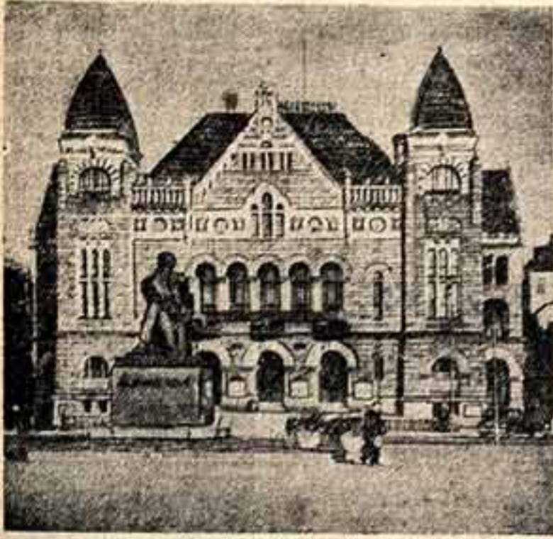
Хельсинки. Здание Финской национальной оперы, где выступала группа артистов балета ГАБТ. На переднем плане памятник выдающемуся финскому писателю Александру Киви (работа скульптора Вайно Аалтонена).

На днях и вернулся из Финляндии, которую посетил уже в четвертый раз. Впервые это было в 1950 году. Для основных впечатлений вынес я тогда из этой страны, которые с каждым последующим приездом все более углублялись: это высокая музыкальная культура финского народа и большой, искренний интерес к тому, что происходит в СССР, в том числе в музыкальном искусстве.