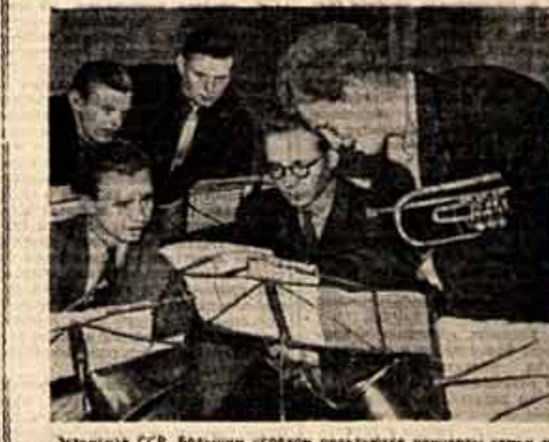
Эстонский ССР. Большие успехи в развитии культуры достигнуты в Эстонии...