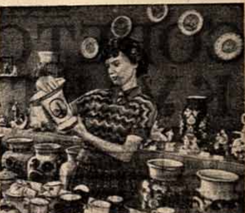
Коллектив Ленинградского фарфорового завода имени Ленинского активно готовится к празднованию 25-летия Ленинграда...