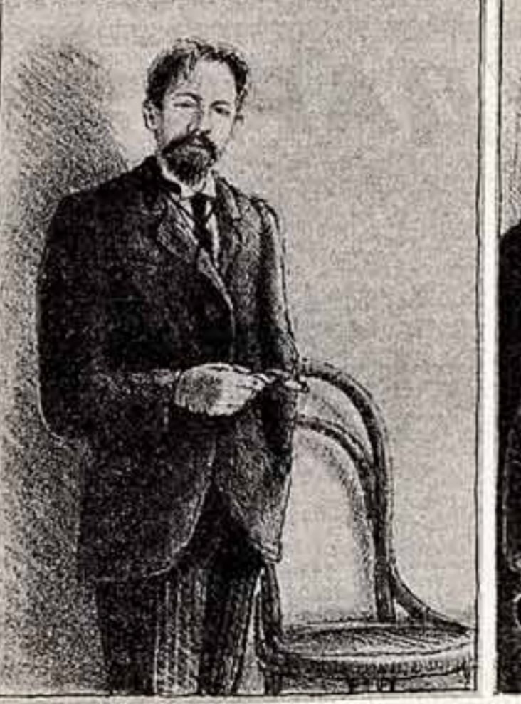
В издательстве «Книга» выходит в свет три популярных произведения А. П. Чехова в одном томе — «Человек в футляре», «Крыжовник», «О любви». Оформляет издание художник Н. Родионов.

В названии города Мелитополь есть частота — «поль», это по происхождению древнегреческого происхождения. Слово «мелитос» в переводе с греческого означает «город».