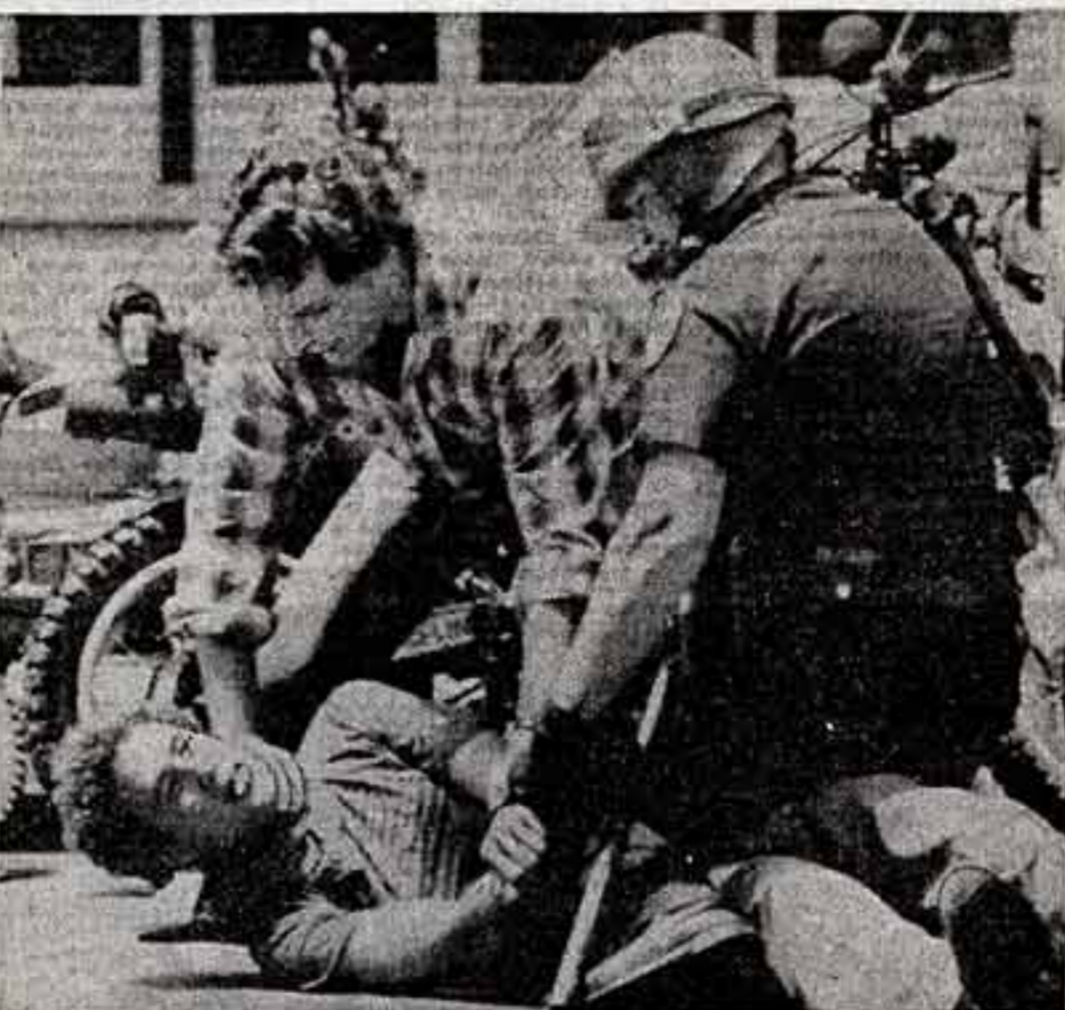
Десятки американцев были арестованы во время разгона полиции демонстрации протеста против милитаристского курса администрации Рейгана...