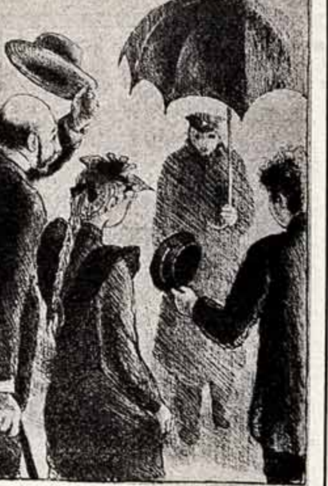
В издательстве «Книга» выходит в свет три популярных произведения А. П. Чехова в одном томе — «Человек в футляре», «Крыжовник», «О любви». Оформляет издание художник Н. Родионов.