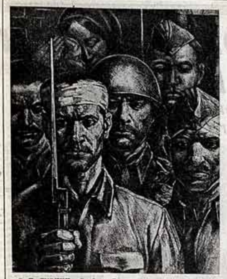
П. ДУРНИН. «Солдаты Бреста».

40 ЛЕТ НАЗАД СОВЕТСКАЯ АРМИЯ ОСВОБОДИЛА БРЕСТ