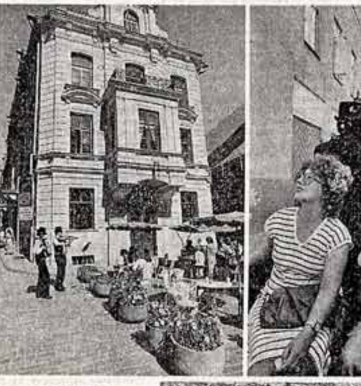
РИТМЫ СТАРОГО ТАЛЛИНА

бумаже. Тут срывается привычный интерес читателя. Иное дело научно-популярная книга. Сюжеты ее, как правило, «недетективные».