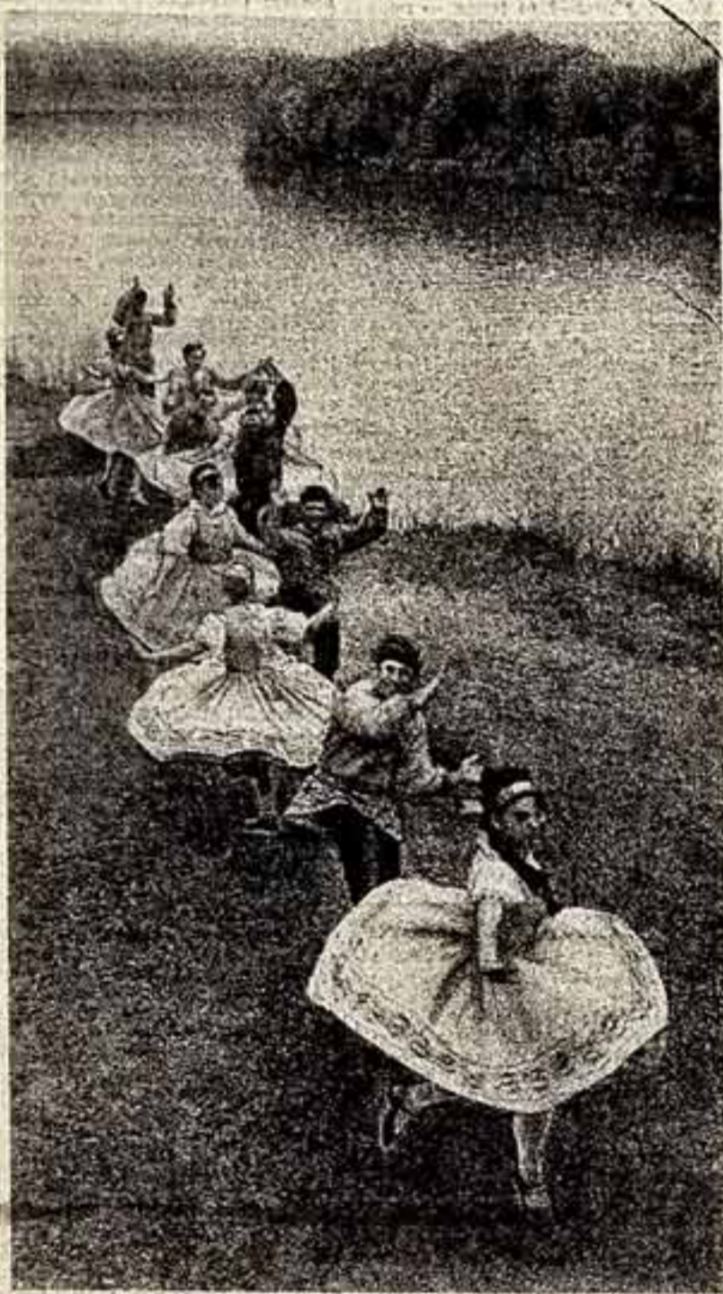
Большой успех достигли самодельными коллективами Молдавии. Сейчас в них участвует свыше двухсот тысяч человек. Около ста сорока коллективов заслужили почетное звание народных. Лучшие из них выступают в других республиках нашей страны и за ее пределами.

(Из Постановления ЦК КПСС «О подготовке к 50-летию образования Союза Советских Социалистических Республик»)