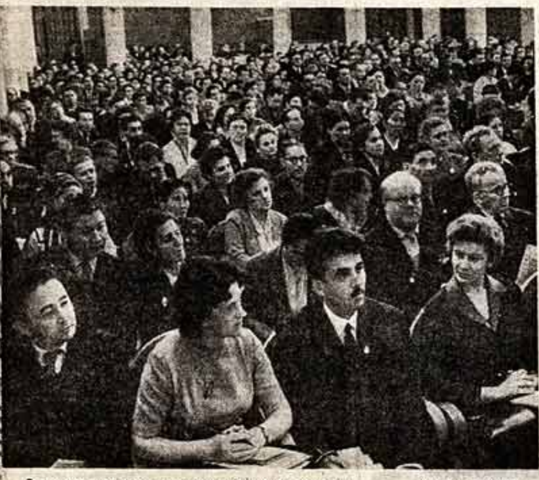
В зале заседаний IV съезда профсоюза работников культуры.