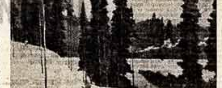
Г. Нисский, «Пейзаж».