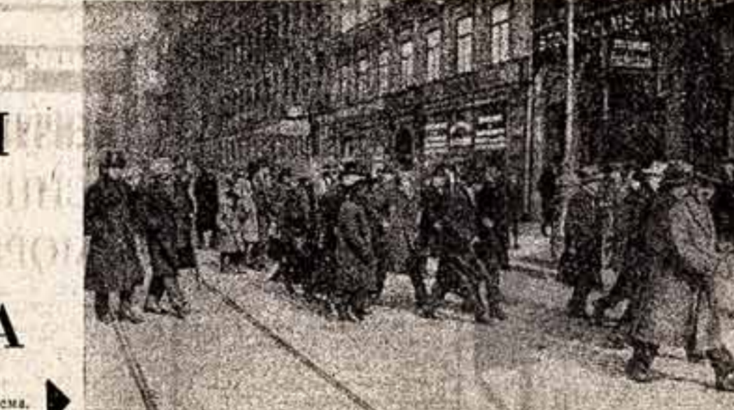
Ленин на Васэгатах.