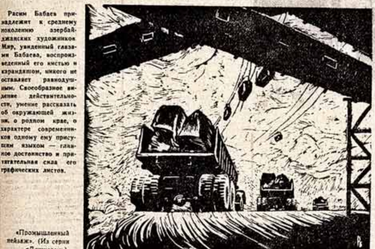
«Промышленный пейзаж». (Из серии «Дашкесан»).