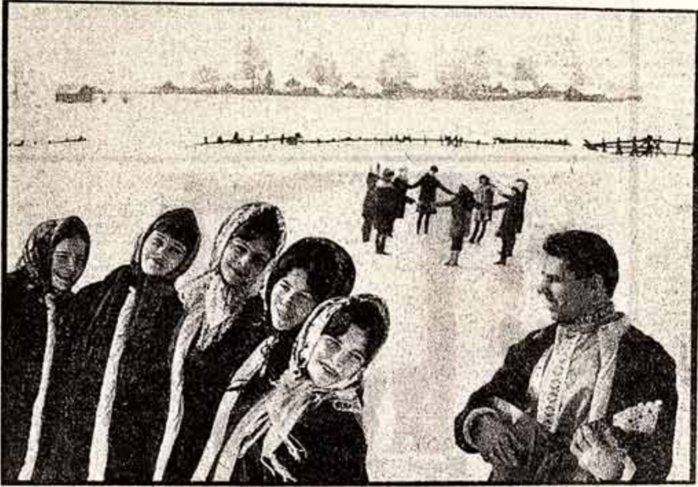
«...В поселке Красное, на Волге, живет легенда»...

Подумать бы, о чем нам чаще напоминают: об исключительной дешевизне печатной продукции в нашей стране — или о бесценности каждой книги, хотя бы ее стоимость выражалась в копейках? О наших гигантских тиражах (триста миллионов старых учебников ежегодно!) — или о выжужженных перекладных? КНИГА — ИСТОЧНИК НАШИХ ЗНАНИЙ, ИСТОЧНИК БОГАТЕЙШИХ, НЕИССЯКАЕМЫЙ. ПОЧЕМУ ЖЕ ПОДЧАС МЫ ПОЗВОЛЯЕМ СЕБЕ ПРИКАСАТЬСЯ К НЕМУ ГРУБО, ОТНОСИТЬСЯ НЕУВАЖИТЕЛЬНО?