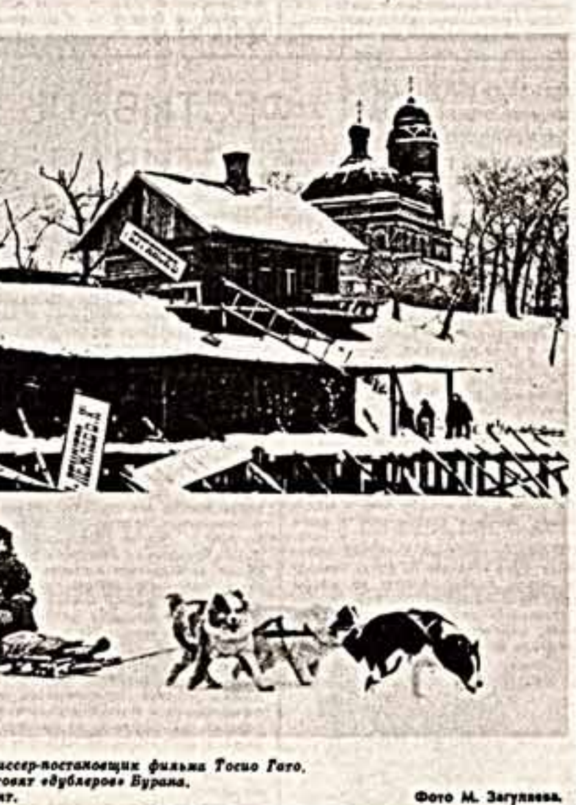
Главный режиссер-постановщик фильма Тосио Гато. К съемкам готоват «дублеров» Буря. Рабочий момент.

Для съемок были специально отловлены две группы волков. Но возможности диких