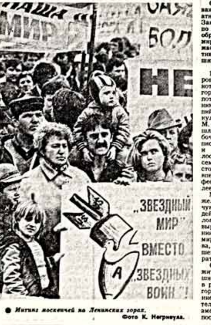
Митинг москвичей на Ленинских горах.