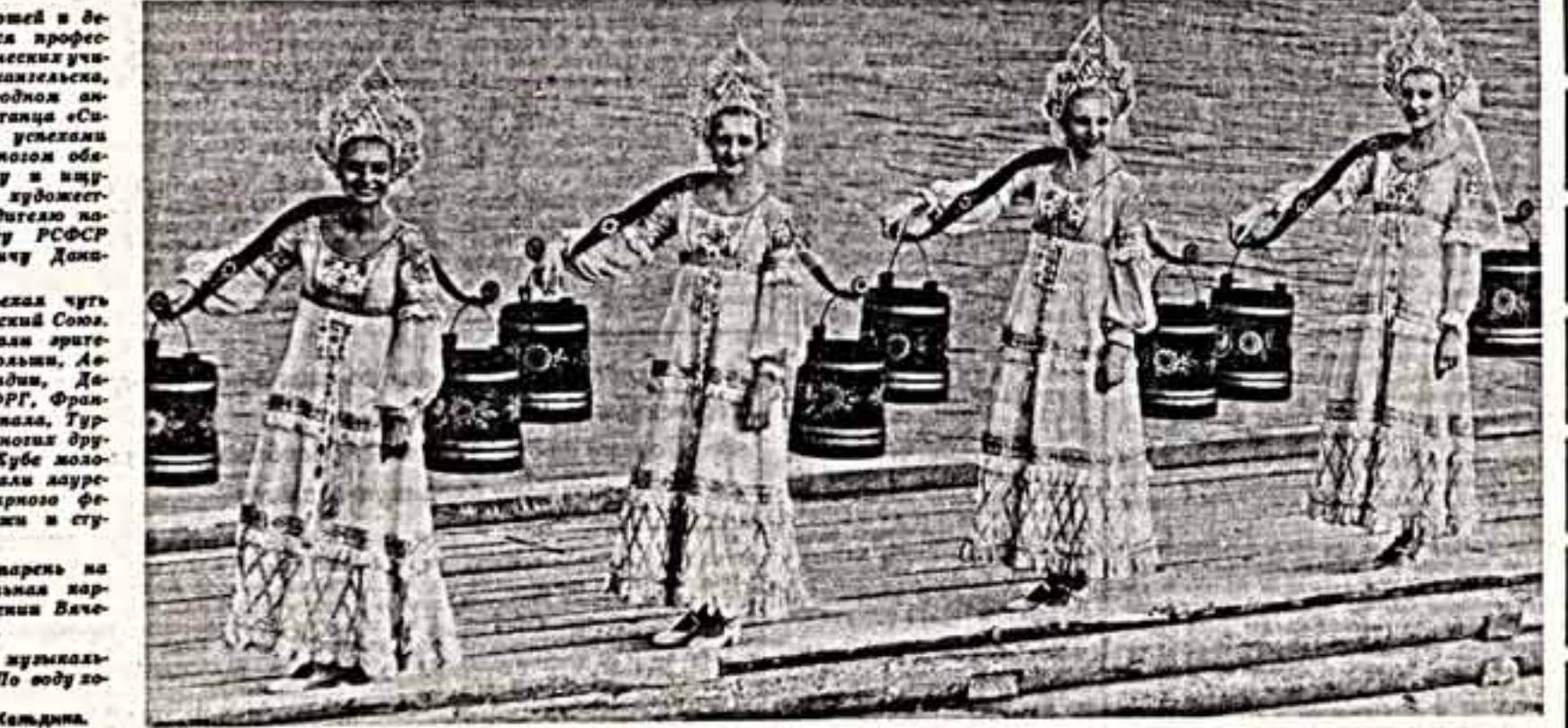
Ансамбль обещал чутк ли ва вес Советский Союз. Ему аклодировали артила Болгарии, Польши, Австри, Финляндии, Дании, Швеции, ФРГ, Франции, Кипра и многих других стран. На Кубе золотые сестры стали лауреатками XV Всемирного фестиваля молодежи и студентов.

Более ста имен и фамилий, учащих профессионально-технических училищ городов Арзамасская, тапчуют в народном ансамбле весна и танца «Сиверко». Соавла устелла «Сиверко» — женова обавон, курожилло и вприски, жидолово, худомест-екилово рукообидело народному артисту РСФСР Борису Невалячу Доклюво.