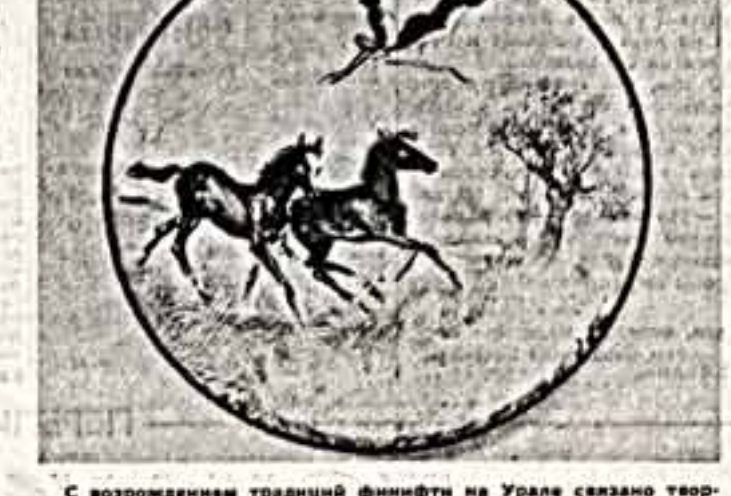
С возрождением традиций финифти на Урале связано творчество художницы Перисиды экспериментального заводоуправления Людмилы Краченко.