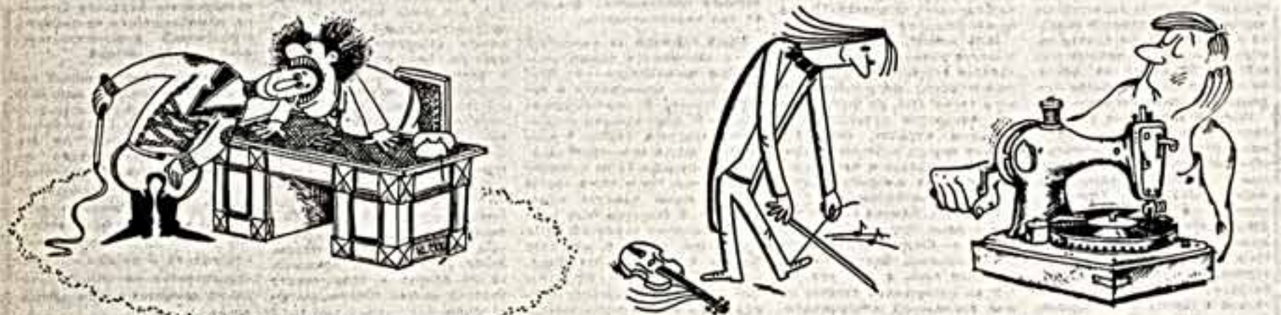
Рисунки И. Челомеева, В. Владова, В. Уборевича-Боровского.