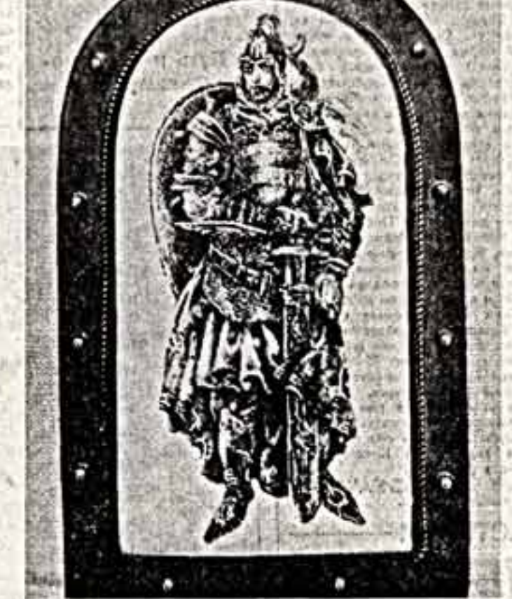
Разнообразна тематика ее произведений. Художница создает серии миниатюр, посвященных «Слову и делу» и «Уральским сказкам, древнерусному зодчеству».