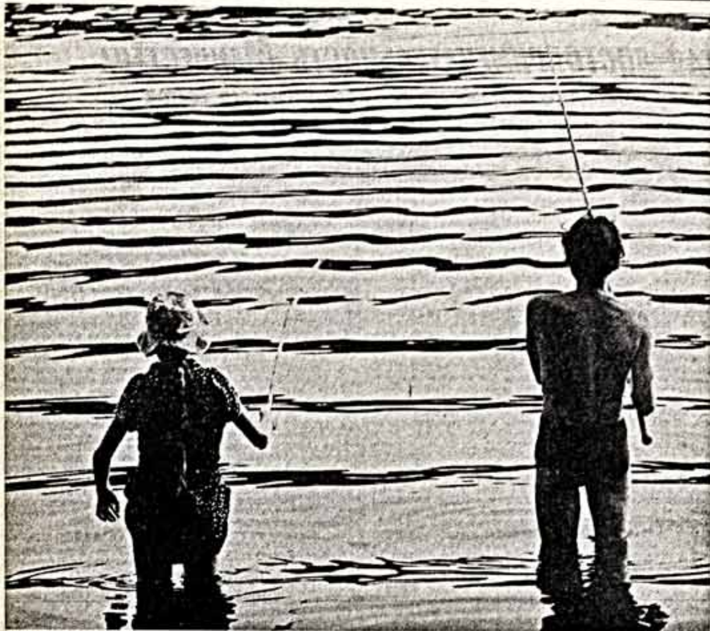
ФОТОКОНКУРС Ю. ФЕДОТОВ. «Кто-то, не знает...»