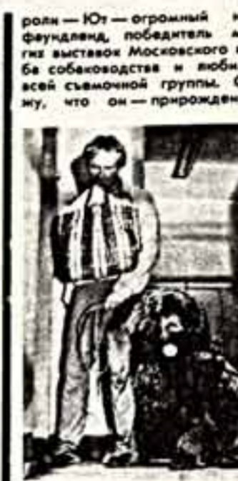
Актёр, как говорится, от природы.