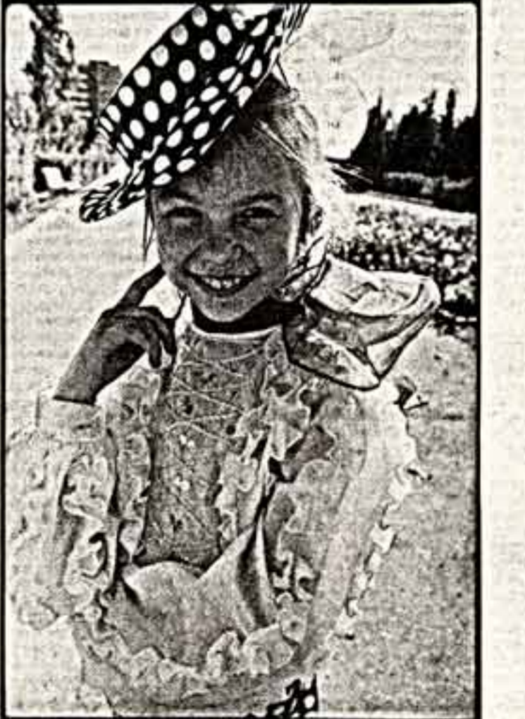
Вот уже десять лет демонстрирует свое искусство хором графический ансамбль «Радуга» Дворца культуры и техники металлургов г. Ташкента. Этому коллективу присвоено звание «образцово-показательный». Перед вами один из спектаклей ансамбля.