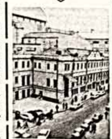
Закончена десятилетняя реставрация МХАТа. Что ждет зрителей в новом здании, над чем работает группа — это вы сможете узнать из репортажа нашего корреспондента (стр. 3).