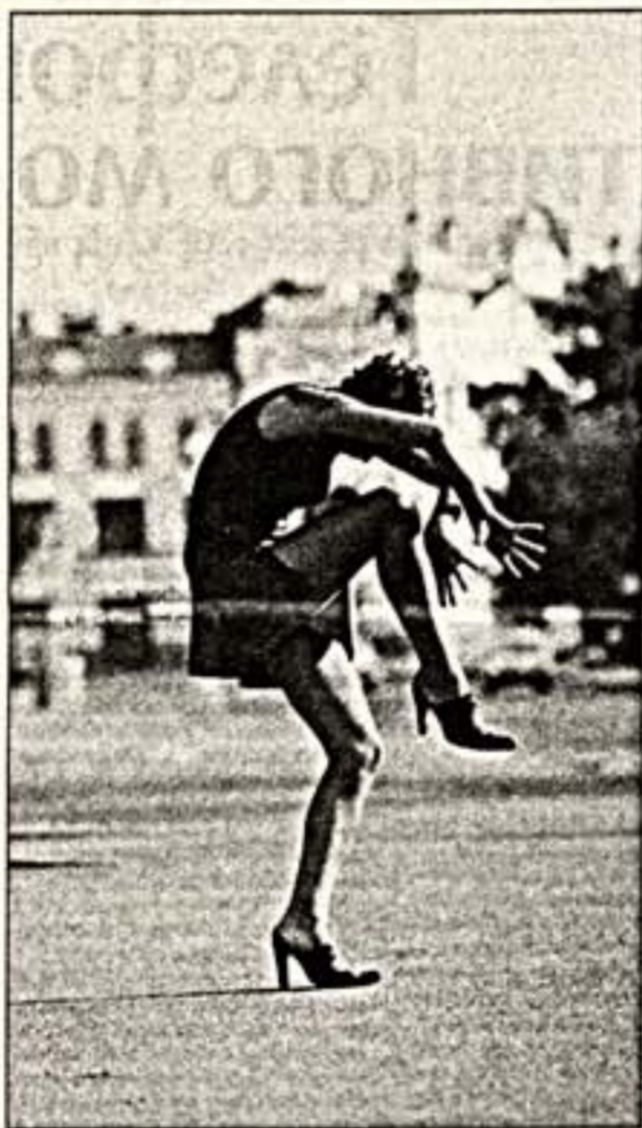
Очарование старых улочек Томска, строгую классическую красоту старинных особняков и грацию молодости зарисовал в своих снимках фотохудожник Александр Паутов.

В художественном музее открыта персональная выставка Александра Паутова