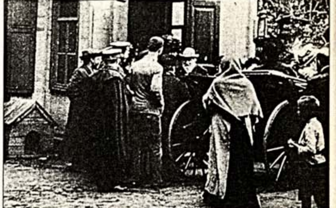
Л.Толстой. 1910 г. Последняя съемка перед уходом из Ясной Поляны

И вот печальный финал. Ноябрь 1910 года, станция Астапово, где Толстой, божьих из Ясной Поляны, оказался смертельно болен. Последний из многоликого рода Толстых прибыла Софья Андреевна. Насколько была жизнь супругов, особенно в последние годы.