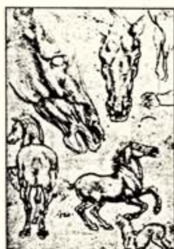
выполнили наш проект за семь месяцев: по нашей модели - 2,5 x 2,5 м - отлили скульптуру в натуральную величину.