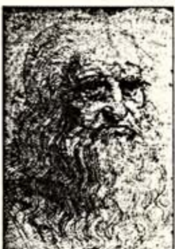
Слева: автопортрет Леонардо да Винчи. В центре: модель скульптуры в натуральную величину.