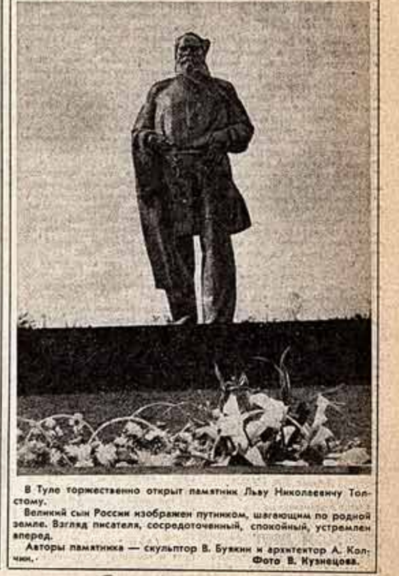
В Тулу торжественно открыт памятник Лавру Николаевичу Толстому. Великий сын России изображен путником, шагающим по родной земле.

ГАСТРОЛИ АРТИСТОВ ПОЛЬШИ Варшавский драматический театр «Народов» завершил выступления в Москве.