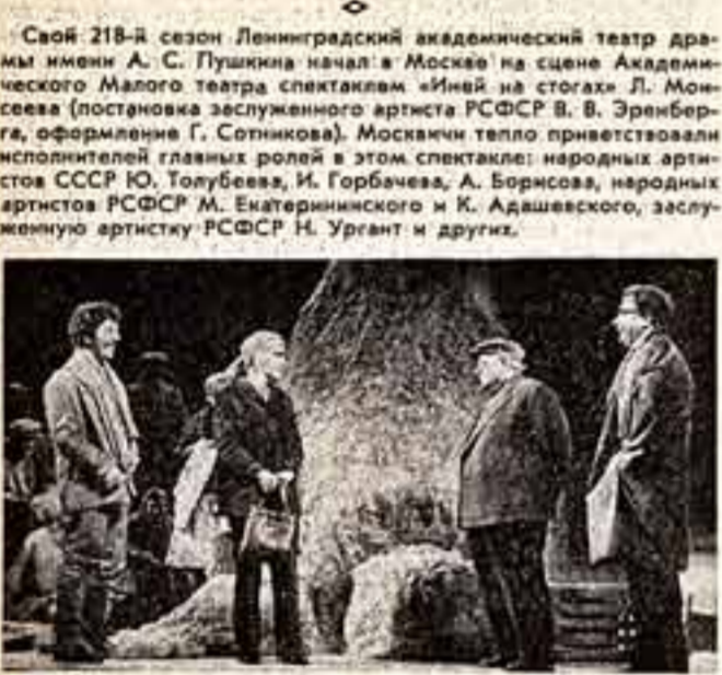
Сцена из спектакля «Иней на стогах».