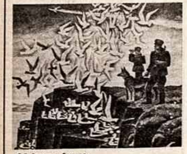
В. Смирнов. «Граница».