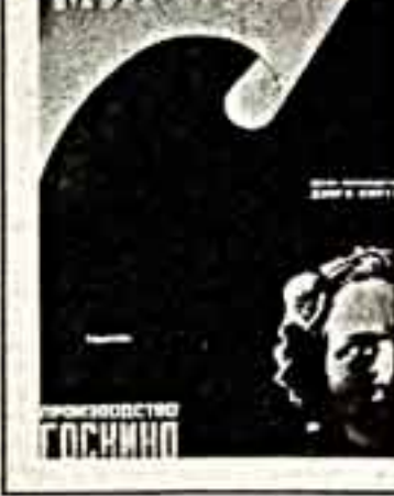
А. А. Родченко в производственном костюме (модель автора). 1922 г. Газетный киоск (проект для конкурса), 1919 г. Эскиз костюма и сплентало «Героиня Падуна» О. Уайльда. 1914 г. Планет и фильму Дзиги Вертова «Шестая часть мира», 1926 г. Пространственная конструкция «Обвал в овраге», 1926 г. Фотопортрет матери. 1924 г.