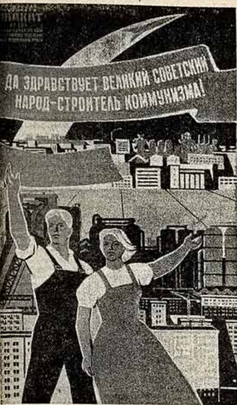
Планет художника Р. Вардугулицы. (Мастерские планетов Союза художников СССР в московском отделении Союза художников РСФСР).

В Минске возводится кинофабрика «Беларусь-фильм», первая очередь которой пойдет в строй в этом году.