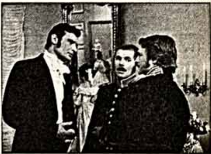
Полосу подготовила Клариса ПУЛЬСОН