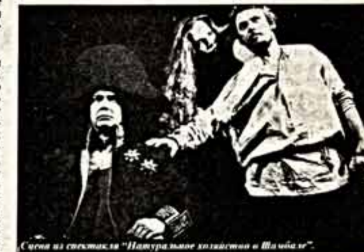
Сцена из спектакля "Натуральное хозяйство" в Шамбале"