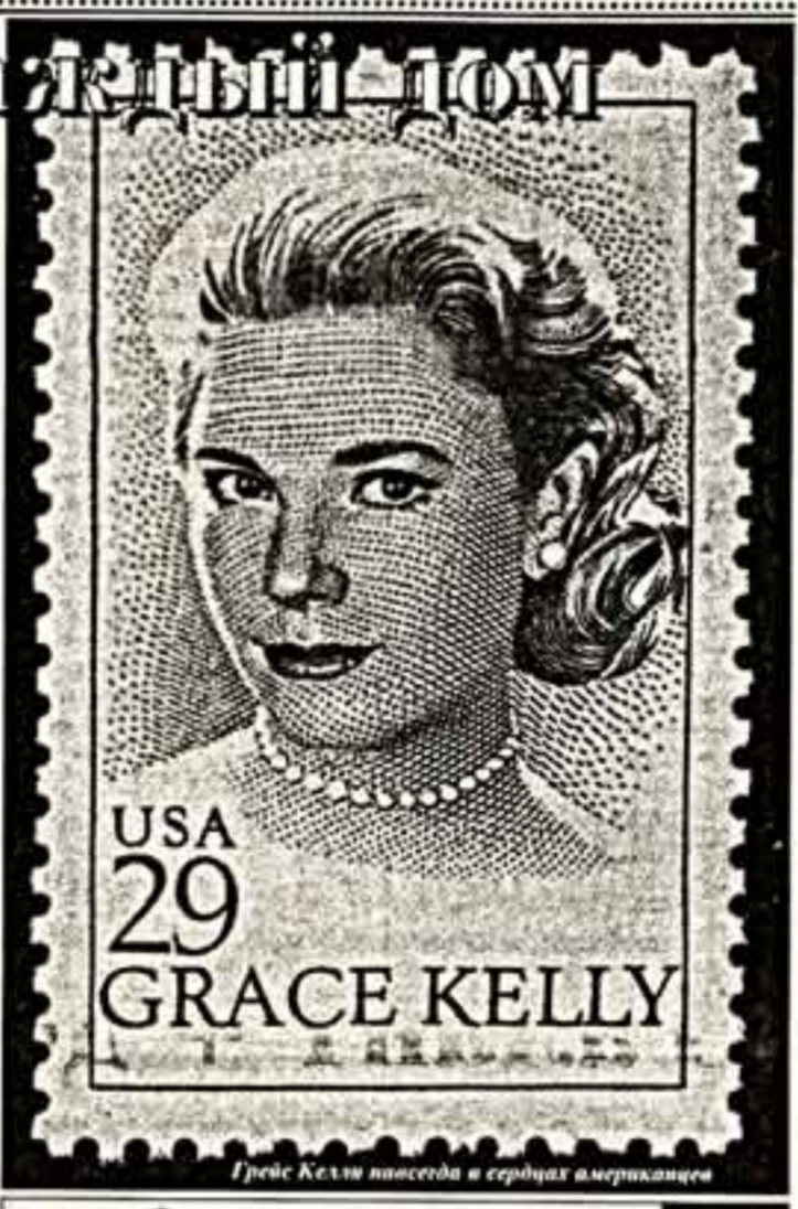
Грейс Келли восточная и сердцата американка

Прежде всего я был поражен его размахом. Большие кинозалы с первоклассным техническим оснащением. Огромное число зрителей. Среди множества художественных фильмов было несколько прекрасных, достойных любого фестиваля — уровня Канн. Картины оценивало жюри, работало международное жюри, все компетентные, милье люди, работали весело, с юмором. Словом, вся организация кинофестиваля отвечала — честно говоря, не ожи-