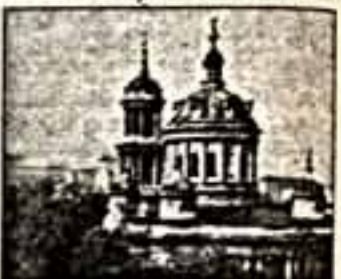
Уважаемая редакция! К вам обращается коллектив Государственного архива печати (ГАП) Российской книжной палаты с просьбой помочь разрешить трудную задачу.

На протяжении десятилетия Государственный архив печати собирает и хранит все виды печатной продукции в качестве национального страхового фонда. В настоящее время его фонды насчитывают более 72,5 млн. единиц хранения и являются наиболее полным собранием отечественной печатной продукции в стране. До конца 80-х годов фонды ГАП были рассредоточены в 10 филиалах Москвы и Московской области. Ежегодные поступления в 1,300 тыс. экземпляров складывались в непригодных для хранения помещениях, что приводило к преждевременному их старению и частичной утрате. В 1985 г. положение с хранением фондов Государственного архива печати стало непереносимым, что послужило поводом к началу строительства здания на Коммунистической ул. в г. Москве, рассчитанного на размещение 100 млн. единиц хранения. Масовое переоборудование ретро-спективного фонда в филиал архива в г. Можайск в основном было завершено в 1991 году. И все же значительные объемы текущих поступлений за последние 5 лет и наиболее ценная часть изданий 1917-1930 гг. продолжают храниться в храме Мартина Исаеведника, что на Большой Коммунистической ул., 15, ожидая переезда в "Дом книги". Здесь в Москве хранится часть фонда, которая находится в постоянном обращении.