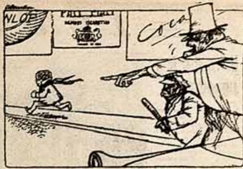
«Ардустига его немедленно... Время работает на коммунизм».