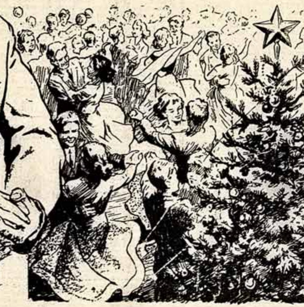
Рисунки Е. СОЛОВЬЕВА.