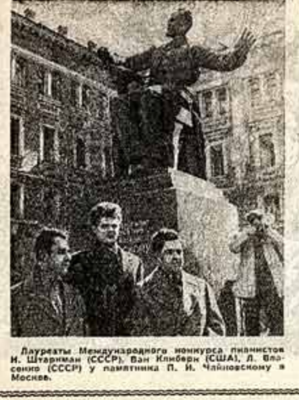
Лауреаты Международного конкурса пианистов И. Штермана (СССР), Ван Клиберна (США), Я. Власов (СССР) и павильон П. И. Чайковского в Москве.