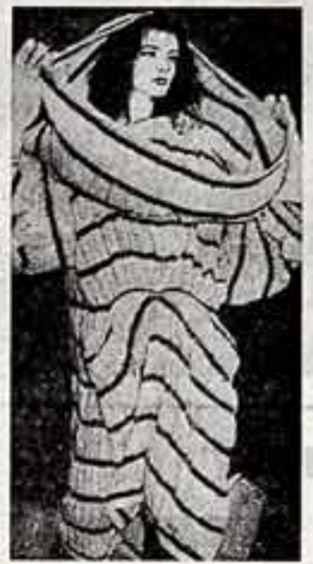
На «глаз-представлении» в Париже. Экстравагантный народ Исси Мияки в стиле «кимоно».

«Мода начинает функционировать, лишь когда выходит из салонов и мастеров на улицы. Этот афоризм одного из законодателей французской моды Коко Шанель обрел в минувшем году неожиданное подтверждение: немало парикмахов появились на улицах в одеяниях, сшитых по эскизам японских модельеров. Что это, очередная прихоть? Не только».