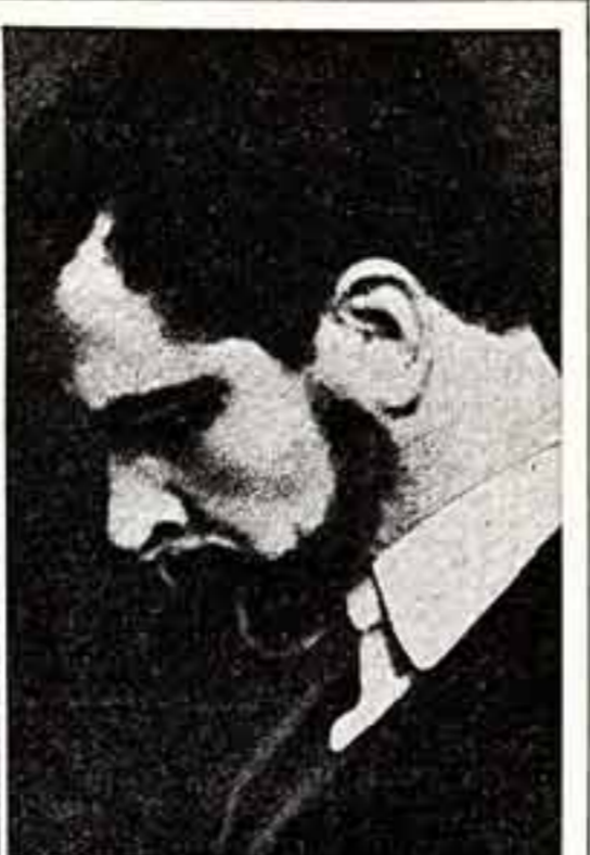
Евгений Лебедев, народный артист СССР

«Что у меня тут под ногами, что передо мной, что по бокам — ничего и этого не знаю и не помню... А у нас у родителей в смазных сапогах да на постылых шагах отлучались...» Чувство Рогожина толкает его на самые иррациональные меры — он понакает на отцовские деньги пару бриллиантовых подвесок для подарка Настасье Филипповне. Хотел ли Рогожин «купить» Настасью Филипповну подвесками,