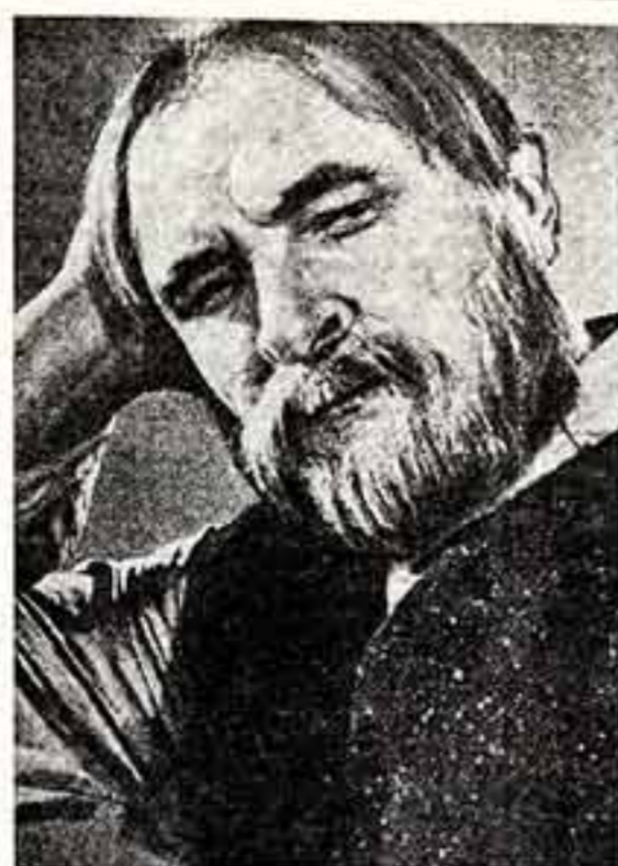
Евгений Лебедев, народный артист СССР

Вполне понятно, что и при обсуждении спектакля нам оставалось ждать. Заметила нас критика или нет? Может быть, ей ничего было не нас сказать? В конце концов обратились ко мне. Главной упрям был в том, что мой Рогожин — это Островский, а не Достоевский, особенно в первой его половине, до сцены обмена крестами. Дальше можно было верить в мои чувства и сопереживать вместе со мной, со-