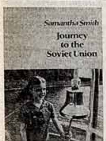
Саманта Смит написала книгу