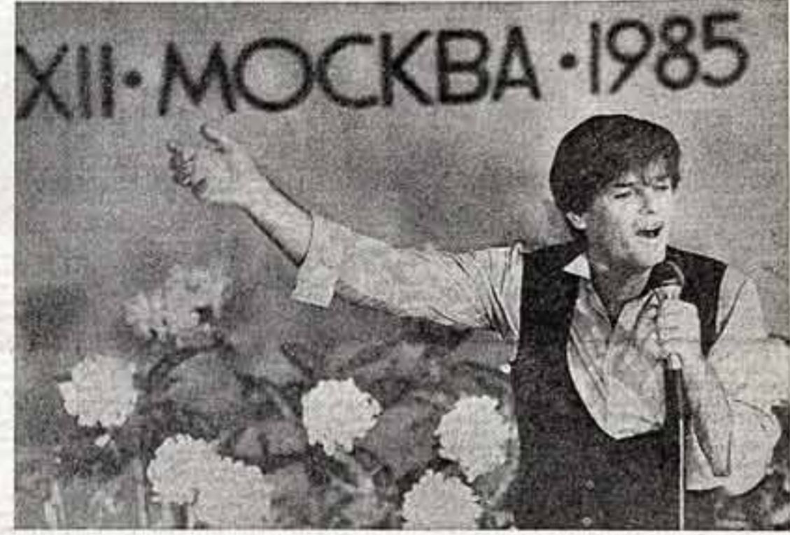
тинской Америке. Особый успех сопутствует ему в Чили и Аргентине. В книге «Рождается в сердце, выпущенной в 1983 году издательством «Молодая гвардия» и прослеживающей биографию Дины Риды, есть фотографии: аргентинские поклонники восторженно приветствуют артиста. В сентябре 60-х годов Дин жил в Аргентине: здесь с его участием, здесь он вел каждую субботу популярное телешоу, здесь его вымывали в таянкую прорывную после того, как он выступил в эфире индере с Валентиной Терешковой, здесь фашиствующие молодчики обстреляли его дом. В 1965 году Дин был членом именованной аргентинской делегации на Всемирном конгрессе сторонников мира в Хельсинки. В 1966 году военный режим выслал Дина. Четыре раза он пытался вернуться легально — не пустили. В 1971 году он подпольно пробыл в Уругвае и на три недели попал в тюрьму. И вот — возвращение. Дин был чрезвычайно рад, что спустя 18 лет смог свободно ступить на аргентинскую землю. Я приехал по приглашению Аргентинского совета мира. У меня были очень насыщенные дни: встречи со старыми друзьями, беседы с представителями левых сил, участие в митингах, интервью журналистам, выступления по телевизору, где я пел и рассказывал о том, что делал все эти годы. Во время прелюдии военных в Аргентине погиб и пропал без вести десятком тысяч людей. Сейчас в стране идет процесс демократизации общества, и большинство аргентинцев активно участвуют в нем.

Осеню Дин Рид вновь побывал на испляющем континенте — на этот раз в Аргентине и Уругвае. Для того чтобы понять, что значила для него встреча с Аргентинкой, надо вспомнить минувшее. В начале 60-х годов стремительно восходящая «звезда» американской эстрады Дин Рид совершает поистине триумфальное турне по Ла-