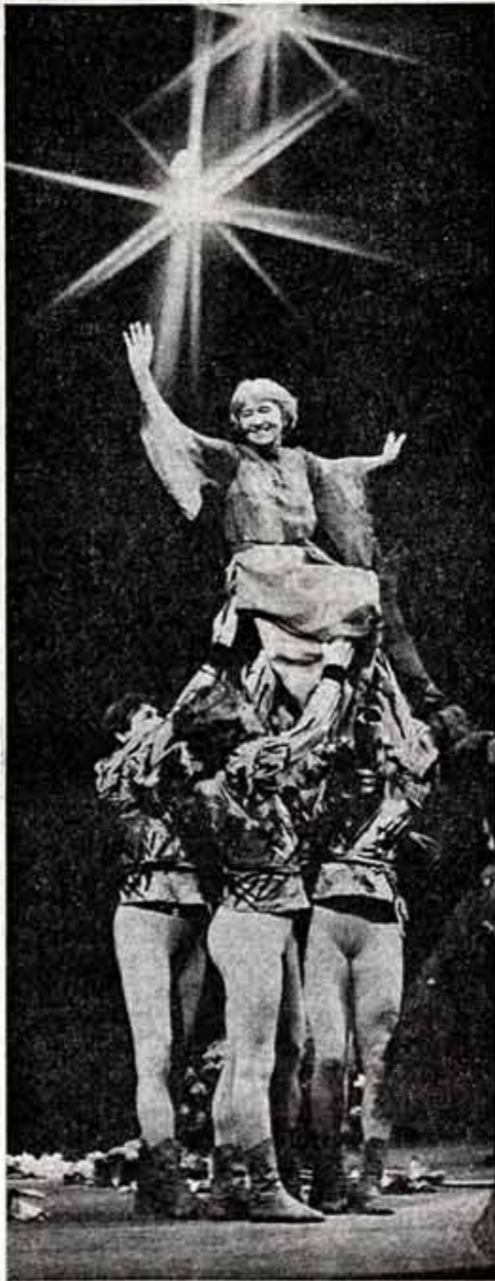
Большой театр. Торжество в день рождения дважды Героя Социалистического Труда Галины Улановой.

Как это было, могли видеть миллионы зрителей.