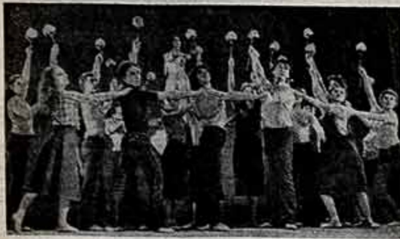
В Саратовском государственном университете имени Н. Г. Чернышевского, которому в прошлом году исполнилось 75 лет, действует около 100 художественных коллективов, в которых принимают участие более 1.600 студентов.

Музыка вокруг нас Разговор о проблемах вокально-инструментальных ансамблей