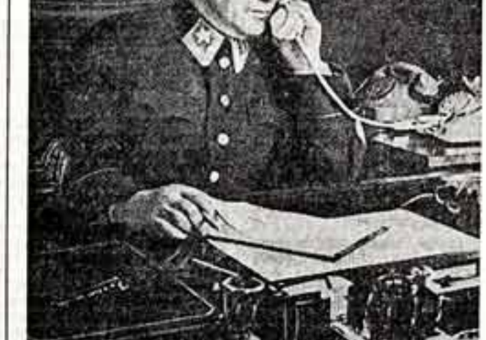
Г. К. Жуков