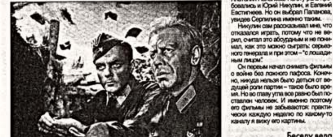
Кадр из фильма "Жизнь и смерть"