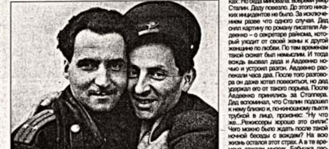
К.Симонов и А.Сталера. Молодые годы