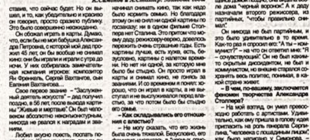
Беседу вел Татьяна КУТАРЕНКОВА