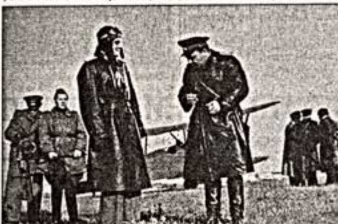
Кадр из фильма "Повесть о настоящем человеке"