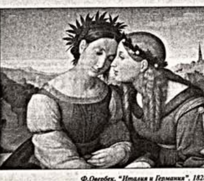
Ф.Овербек. "Италия и Германия". 1828 г.

Президентство Франции в ЕС в 2007 году ознаменовалось большим искусством. В Берлине, в Новой пинакотеке, в грандиозном зале проходит выставка из Нью-Йорка музея Метрополитен "Прекрасные француженки", посвященная французскому искусству XIX века (глаза "культуры" давала подробный анализ выставки), а в Новой Пинакотеке в Мюнхене и небольшом зале экспонируется немецкая живопись XIX века на собраниях Берлина, Дрездена и Мюнхена, упорядоченная по принципу "Возле на Европу". Смысл той и другой акций примерно такой - в Берлине каждая демонстрирует вой Европе, каждая стремится по-настоящему европейской она является (через десять дней после открытия выставки провозглашается расхожая по изданиям фототрагедия ее ступенчатого очертания поистине титана), а в Мюнхене они предстают мидерман философско-идеологическими, которые в течение XIX века свободно путешествовали по странам Европы, несли там самое лучшее, принимали эти лучшие для себя, создавали в итоге пространств научных трудов - интеллектуального фонда объединенной Европы. Сама личность канцлера Ангела Меркель, как известно, очень ученая и образованная дама, написала для каталога толковую статью на тему: "Гражданская война - идеал Европы". Живопись XIX века Франции может гордиться по праву - тут Клод Лавиньер, Карл Юстус Карус, Луидж Рицтери, Отто Рунд, Адольф Мендель, Макс Либман, и выстав-