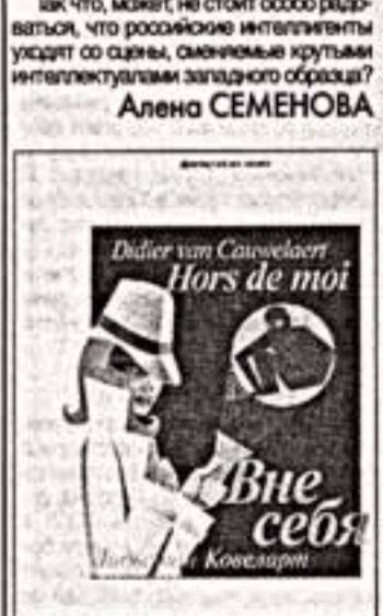
Ван Ковалерт Д. "Вне себя". М.: "Фри Фрай", 2007.