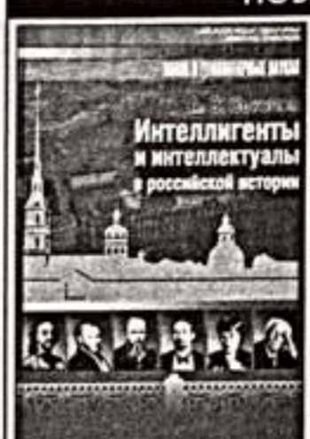
Соколов А. "Интеллектуалы и интеллигалы в российской истории". СПб.: Изд-во СПбГУ, 2007.

В конце адресованной в первую очередь студентам, речь идет о русской интеллигенции: от пореформенного поколения второй половины XIX века до возмужавшего века XX. Автор, не советуя омешивать интеллигентность с интеллигентизмом, выводит типичные образы тех и других и прослеживает их преемственность. А в великой литературе, в частности в "Бесах" Федора Михайловича, уместившаяся определенная интеллигентности и осуждение интеллигентности. Пытаясь понять, кто же существовал: русскую революцию, Аркадий Соколов пишет о недостаточности интеллигентности и безопасности русского самодержавия, когда "Земли дворцов отделили себя от русской культуры непроницаемой стеной..."