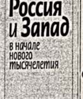
"Россия и Запад в начале нового тысячелетия: Сборник статей". М.: "Наука", 2007.

Многие важные тенденции современной литературоведческой мысли получили конкретные выражения в новом коллективном труде Института мировой литературы им. А.М. Горького РАН "Россия и Запад в начале нового тысячелетия" (ответственный редактор и составитель А.Ю. Бондаренко). Во главе угла научного проекта, объединившего ведущих ученых из России, США, Великобритании, Франции, поставлено осмысление "взаимопроникновения и интерпретации образов России и России в западной литературе и науке; образов Запада и периферийной западной литературы - в русской литературной и научной мысли".