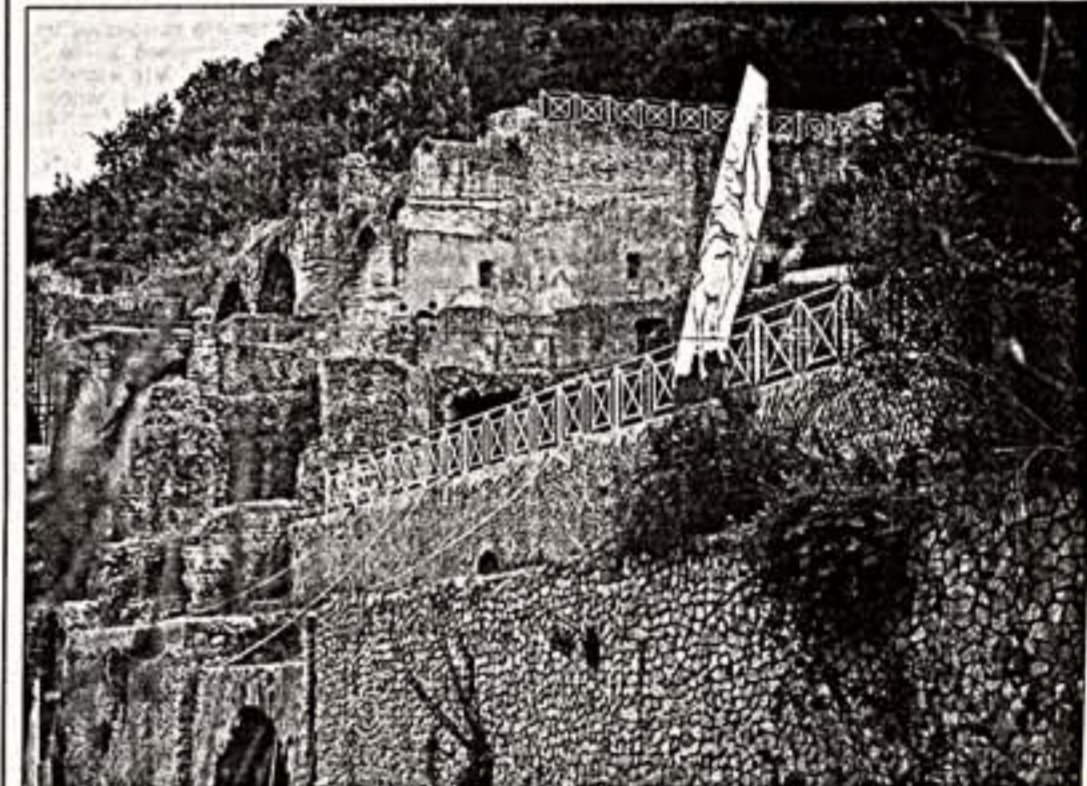
Подготовка к спектаклю в термах

Театральная жизнь в итальянском государстве театров стивает к началу - октябрь. Ожидается в сентябре - октябрь. В июле и августе наступают время музыки на открытой площадке - стартуют главные оперы фестивалей. Задумываются все мыслимые и немыслимые античные руины, в первом приближении напоминающие театр. Недавно появилось большое количество спектаклей в природе. Недавно появилось большое количество спектаклей в природе. Недавно появилось большое количество спектаклей в природе. Недавно появилось большое количество спектаклей в природе. Недавно появилось большое количество спектаклей в природе.