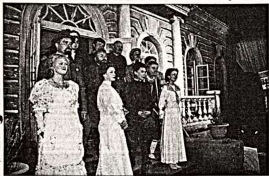
У парадного подъезда