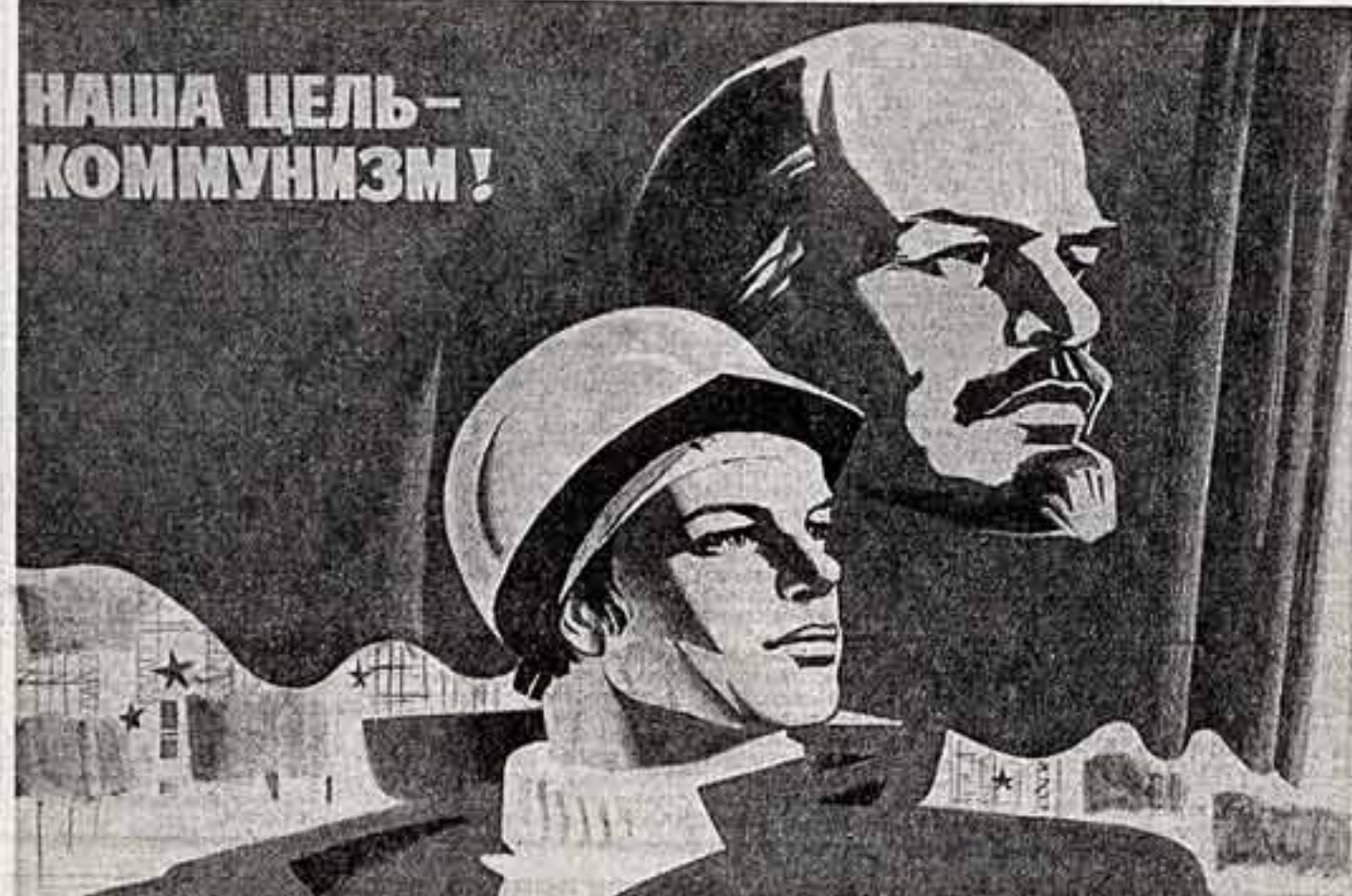
Плакат работы художника Э. Арцруняна. (Издательство «Плакат»).

В нем помещена большая корреспонденция «Всероссийский съезд революционной социал-демократии». Первая часть ее озаглавлена «Доклады с мест» и рассказывает об атмосфере съезда,