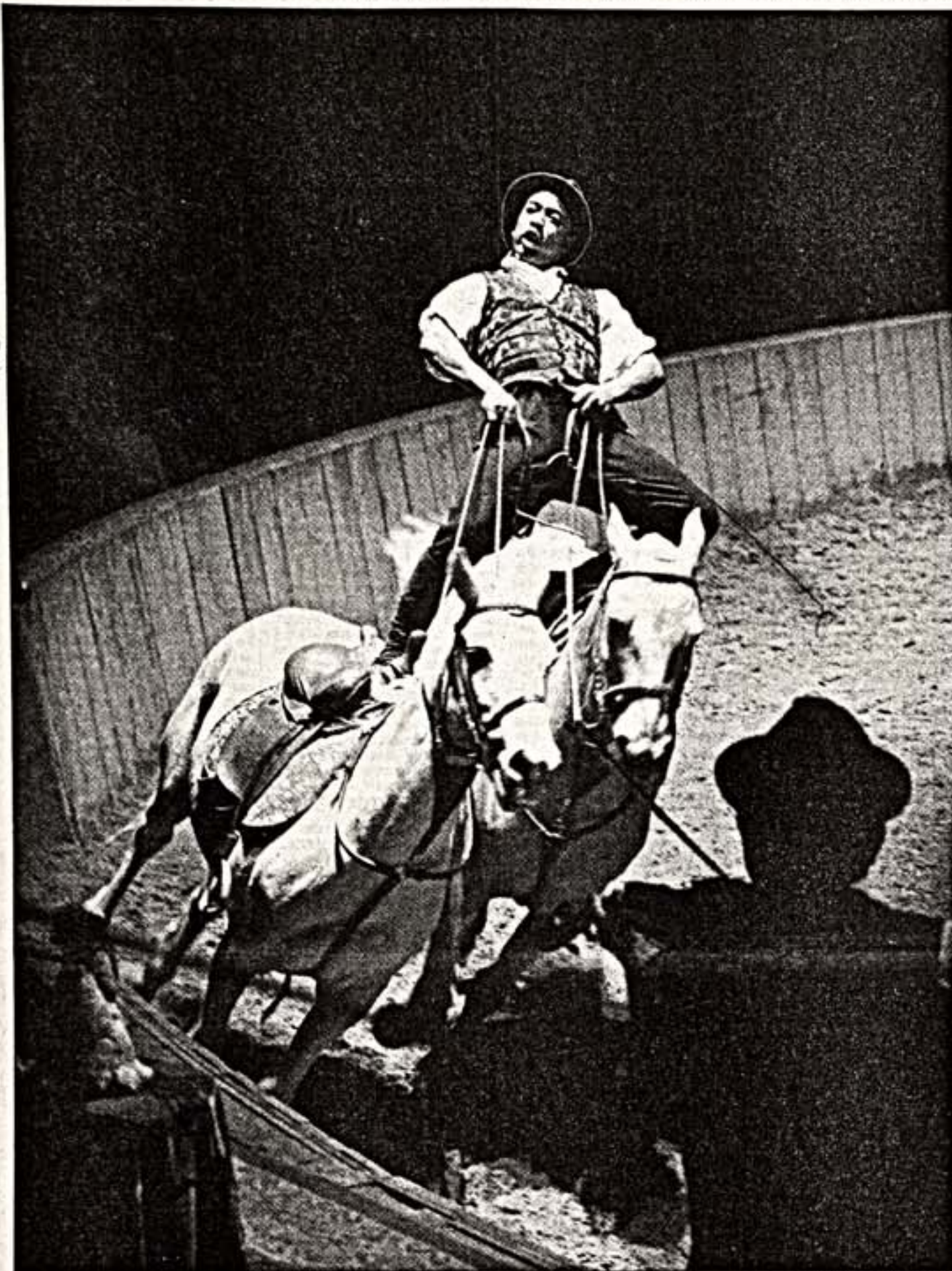
На арене — "Зенгаро"

Открылся VIII Московский международный фестиваль имени Чехова